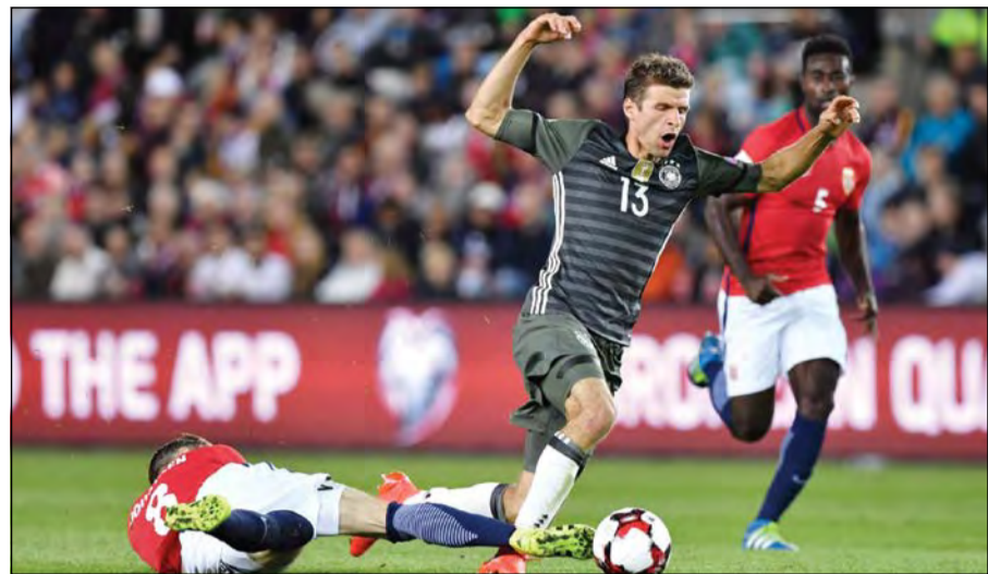
توماس مولر يتعرض لعرقلة

وفي المجموعة الأولى يخرج منتخب فرنسا وصيف أوروبا للامقاة بيلاروسيا فيما تلحق السويد مع هولندا وبلغاريا مع لوكسمبورغ في المجموعة ذاتها. وبعد الفشل في التأهل إلى يورو 2016 يأمل منتخب هولندا في استعادة هيئته تحت قيادة المدرب داني بليند، ولكن الهزيمة ويدا أمام