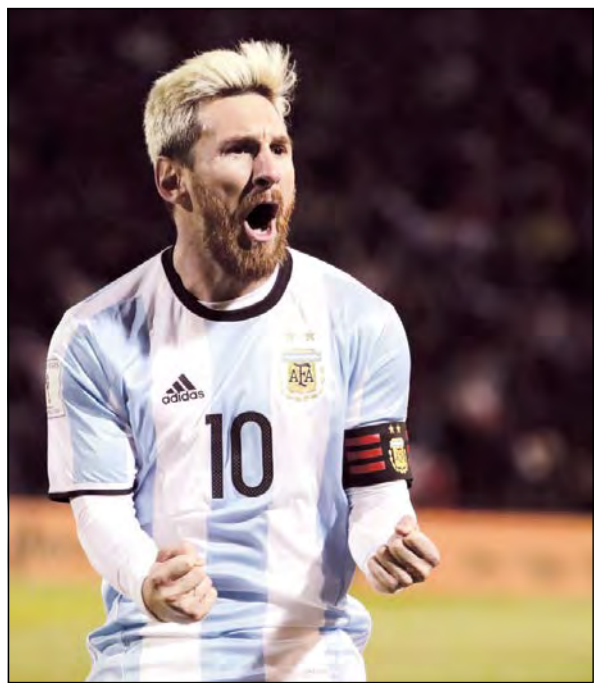
ميسي نجم برشلونة

واعترف ليو بان ابنه تيغودا قد لا يسير على نفس خطواته، فهو لا يحب كرة القدم «أحاول ألا أهديه أي كرات، إنه لا يحب كرة القدم كثيراً، لكنه بدأ اللعب في ناد وسنرى كيف ستسير الأمور معه».