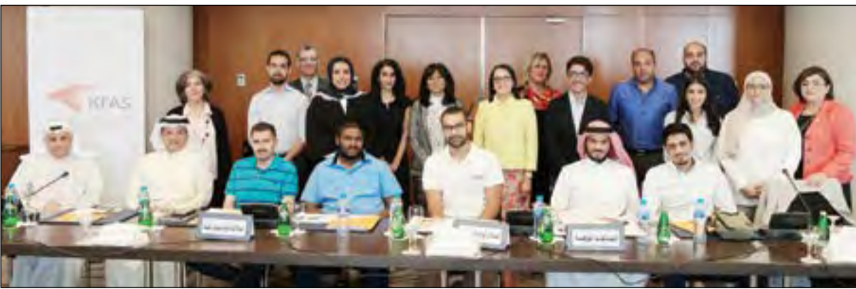
ممثلو الشركات وأعضاء من مؤسسة للتقدم العلمي خلال حضورهم العرض المرئي

في إنتاج صلبوخ مصنع محلي عالي الجودة وتصديره للعالم. من جانبهم، أبدى ممثلو الشركات المدعوة اهتماماً كبيراً بهذه التكنولوجيا الحديثة واستعدادهم لاختبار المنتج في خطوة للتأكد من صلاحيته ومن ثم تصنيعه محلياً. وشدد ممثلو الشركات على أهمية تحديث المواصفات المحلية من قبل الجهات المختصة، وعلى أهمية التواصل مع كل الأطراف المعنية للموافقة على هذه التقنيات الحديثة بحيث يكون إذا أثبت المنتج نجاحه.