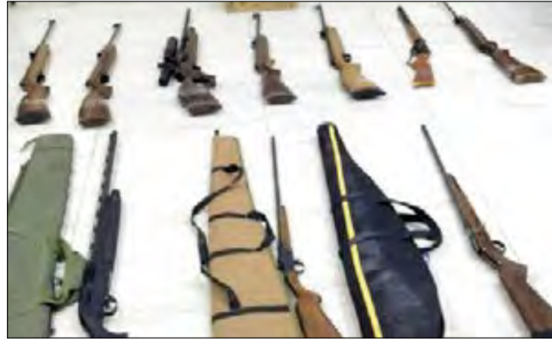
أسلحة تم ضبطها