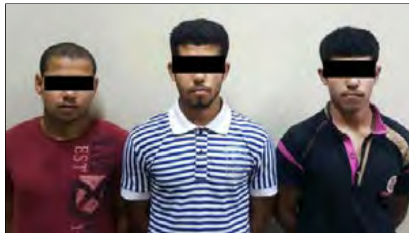
الموصوم الثلاثة في قبضة الأمن