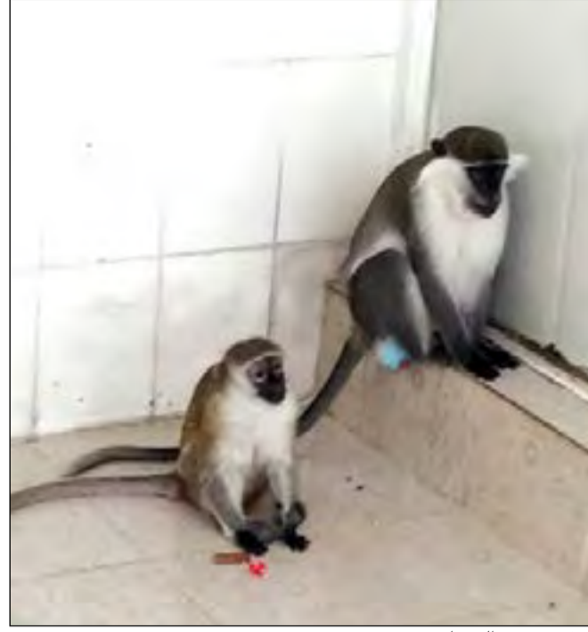
.. وقرود ضمن الحصاد