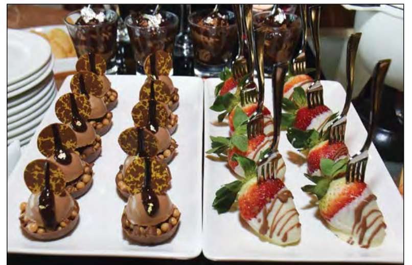
شوكولاتة مميزة بأشكال مختلفة

نظم فندق ومنتجع موفنبيك البدع دعوة على شرف مجموعة من الصحفيين وأصحاب المدونات الإلكترونية بالكويت لحضور ساعة الشوكولاتة التي يقدمها الفندق يومياً في البهو من الساعة الخامسة وحتى الساعة السادسة مساءً. وقد تميز الحدث بالحضور المكثف، وأثنى جميع الحضور على ساعة الشوكولاتة التي تضيء البهجة على فترات بعد الظهيرة. كذلك يستطيع نزلاء فندق ومنتجع موفنبيك البدع الاستمتاع بساعة الشوكولاتة اللذيذة بأشكالها المختلفة التي تقدم الشوكولاتة المميزة، والتي يتم تحضيرها بكل شغف وإتقان من طرف شيف الفندق لترضي جميع الأنواق.