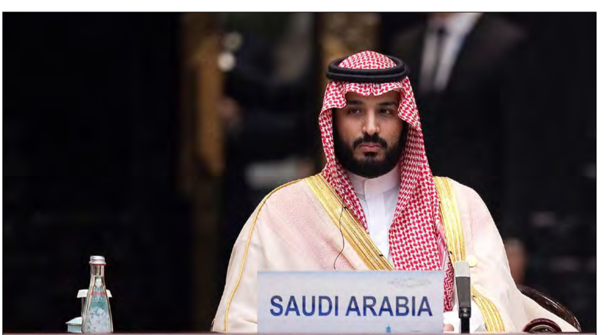
صاحب السمو الملكي الأمير محمد بن سلمان ولي ولي العهد النائب الثاني لرئيس مجلس الوزراء وزير الدفاع مترشقا وفد المملكة في قمة مجموعة العشرين بالبحرين

عواصم - وكالات: بحث صاحب السمو الملكي الأمير محمد بن سلمان ولي ولي العهد النائب الثاني لرئيس مجلس الوزراء وزير الدفاع السعودي والرئيس الروسي فلاديمير بوتين العلاقات الثنائية وتطويرها، وذلك خلال لقائهما على هامش قمة العشرين المنعقدة في الصين. وقال الرئيس بوتين إن بلاده تعلق أهمية كبيرة على توسيع التعاون متعدد الجوانب مع المملكة، معتبرا أن حل أي قضية دولية جديدة يعتبر مستحila بدونها. وأوضح بوتين: «نحن نولي أهمية كبيرة لتوسيع التعاون متعدد الجوانب الذي يعود بالمنفعة المتبادلة مع المملكة العربية السعودية وهذا ينطبق أيضا على علاقاتنا الثنائية، أعني كوننا أكبر الدول المنتجة للنفط وهذا ينطبق أيضا على القضايا الدولية ونحن نعتقد أنه من دون المملكة العربية السعودية، لا يمكن حل أي قضية جديدة في المنطقة». من جانبه، شدد الأمير محمد بن سلمان خلال اللقاء على أن التعاون بين روسيا والسعودية سيعود بالنفع على سوق النفط العالمية. وعلى هامش القمة أيضا، التقى ولي ولي العهد السعودي، مع وزير الخارجية الأميركي جون كيري. وجرى خلال الاجتماع بحث العلاقات الثنائية، والمسائل ذات الاهتمام المشترك. كما استعرض الأمير محمد بن سلمان مع الرئيس التركي رجب طيب اردوغان، العلاقات الثنائية وسبل دعمها وتعزيزها في مختلف المجالات، بالإضافة إلى بحث مستجدات الأوضاع في منطقة الشرق الأوسط.