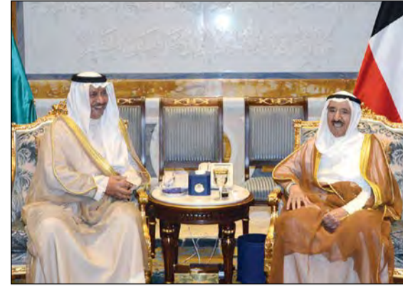
صاحب السمو الأمير مستقبلا سمو رئيس الوزراء الشيخ جابر المبارك

استقبل صاحب السمو الأمير الشيخ صباح الأحمد بقصر بيان صباح أمس سمو ولي العهد الشيخ نواف الأحمد. كما استقبل سموه بقصر بيان صباح أمس سمو رئيس مجلس الوزراء الشيخ جابر المبارك. واستقبل سموه بقصر بيان صباح أمس النائب الأول لرئيس مجلس الوزراء ووزير الخارجية الشيخ صباح خالد. كما استقبل سموه بقصر بيان صباح أمس رئيس مجلس الأمة بالإتابة مبارك الخرينج.