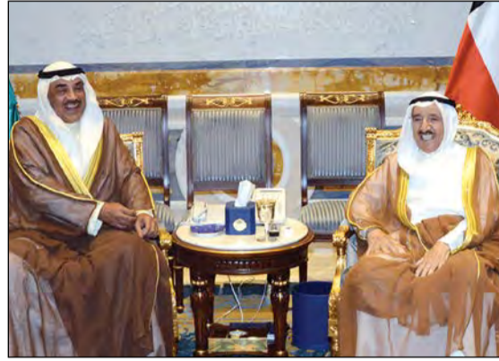
صاحب السمو الأمير الشيخ صباح الأحمد مستقبلا الشيخ صباح خالد