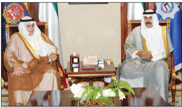
سمو ولي العهد الشيخ نواف الأحمد مستقبلا الشيخ خالد الجراح

استقبل سمو ولي العهد الشيخ نواف الأحمد بقصر بيان صباح أمس سمو رئيس مجلس الوزراء الشيخ جابر المبارك. كما استقبل سموه بقصر بيان صباح أمس النائب الأول لرئيس مجلس الوزراء ووزير الخارجية الشيخ صباح خالد. واستقبل سمو ولي العهد بقصر بيان صباح أمس نائب رئيس مجلس الوزراء ووزير الدفاع الشيخ خالد الجراح. واستقبل سمو ولي العهد بقصر بيان صباح أمس رئيس مجلس الأمة بالإتابة مبارك الخرينج. كما استقبل سمو ولي العهد الشيخ نواف الأحمد بقصر بيان أمس وزير الإعلام ووزير الدولة لشؤون الشباب الشيخ سلمان الحمد ووزير الدولة لشؤون مجلس الوزراء الشيخ محمد العبدالله.