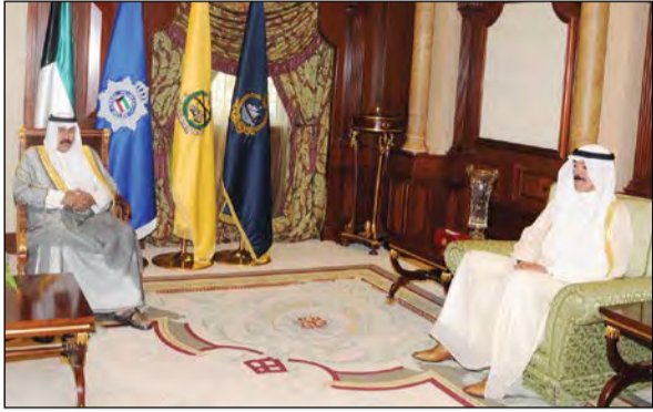
سمو ولي العهد الشيخ نواف الأحمد مستقبلا الشيخ محمد خالد