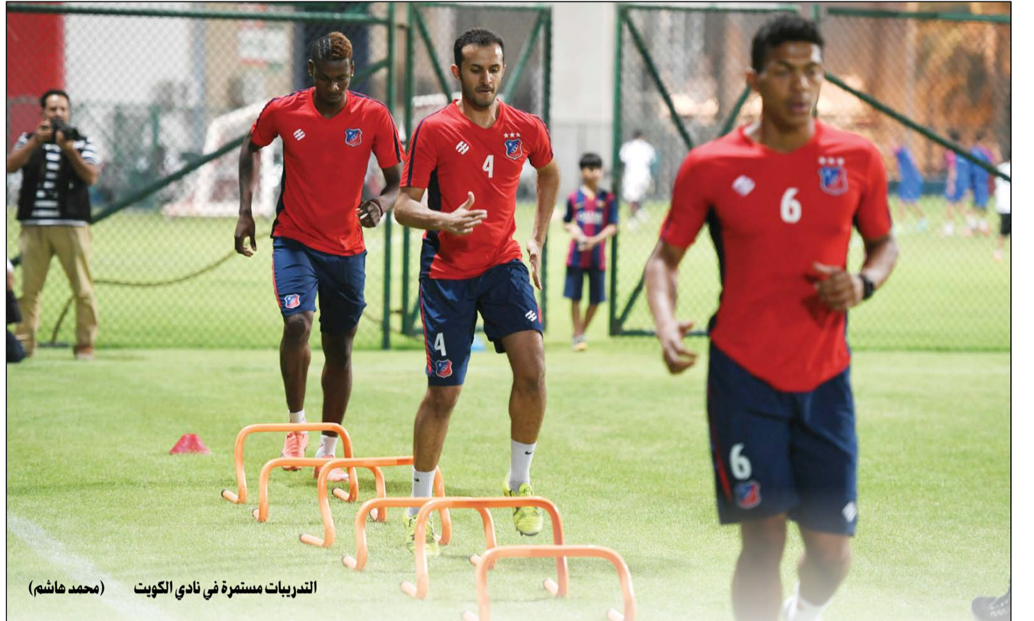
التدريبات مستمرة في نادي الكويت (محمد هاشم)

أكد أمين السر العام بنادي الفحيحيل صالح الجروب عن موافقة مجلس الوزراء على الميزانية المقترحة لإعادة بناء منشآت النادي التي تبلغ 75 مليون دينار، والتي سيتم من خلالها تمويل بناء ستاد رياضي متكامل إضافة إلى حمام سباحة أولمبي وعدد من صالات متعددة الأغراض وذلك بهدف استكمال البنية التحتية للأندية الرياضية