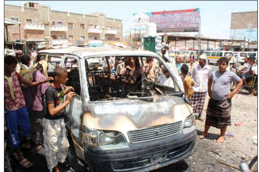
يمنيون يعاينون سيارة تم تفجيرها في لمح معقل القاعدة امس