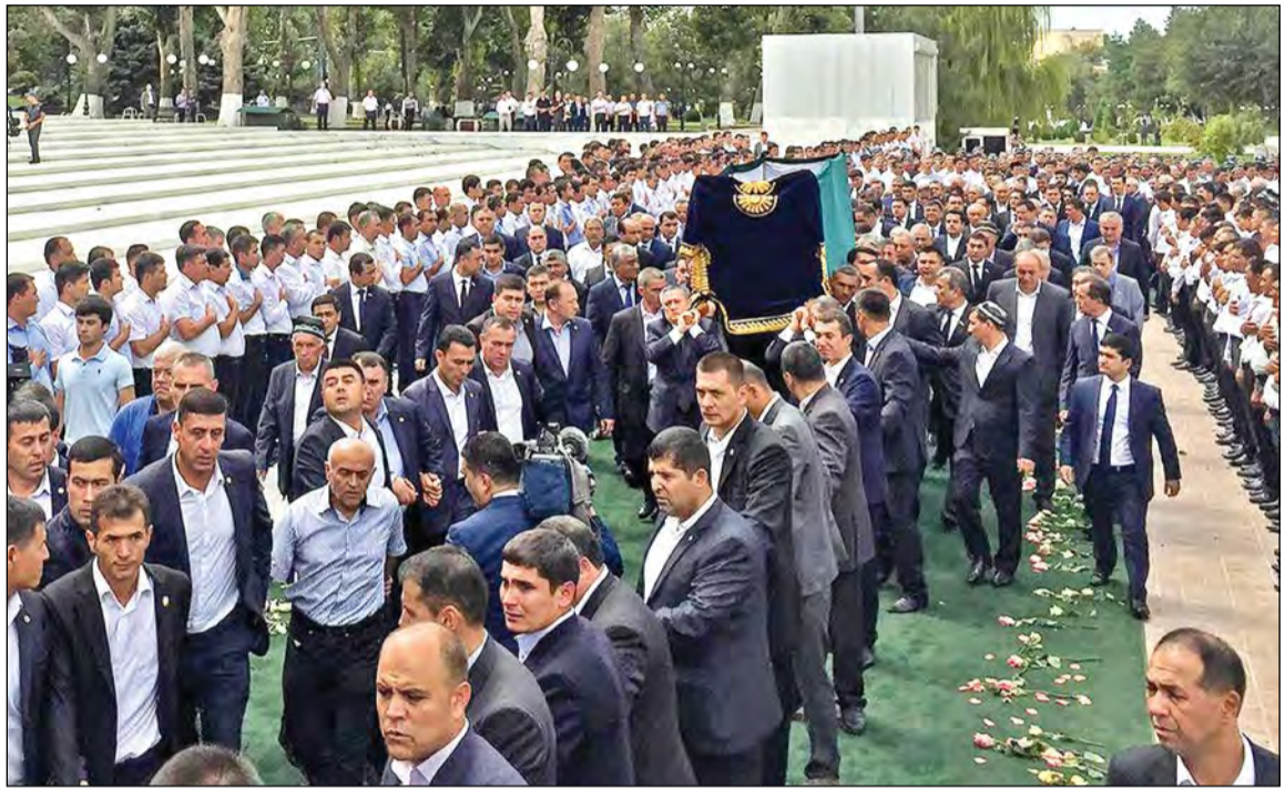
جانب من مراسم جنازة الرئيس الأوزبكي إسلام كريموف في سمرقند امس

بعث صاحب السمو الأمير الشيخ صباح الأحمد ببرقية تعزية إلى الرئيس نعمة الله بولود أنشيف رئيس جمهورية أوزبكستان بالوكالة أعرب فيها سموه عن خالص تعازيه وصادق مواساته بوفاة فخامة الرئيس إسلام كريموف رئيس جمهورية أوزبكستان الصديقة، سانلا سموه المولى تعالى أن يتغمده بواسع مغفرته ورحمته وأن يلهم فخامته والشعب الأوزبكي الصديق وأسرة وذوي الفقيد جميل الصبر وحسن العزاء. وبعث سمو ولي العهد الشيخ نواف الأحمد ببرقية تعزية إلى الرئيس نعمة الله بولود أنشيف، ضمنها سموه خالص تعازيه وصادق مواساته بوفاة فخامة الرئيس إسلام كريموف رئيس جمهورية أوزبكستان مبتهلا سموه إلى المولى جل وعلا أن يتغمده بواسع رحمته ومغفرته. كما بعث رئيس مجلس الوزراء سمو الشيخ جابر المبارك ببرقية تعزية مماثلة.