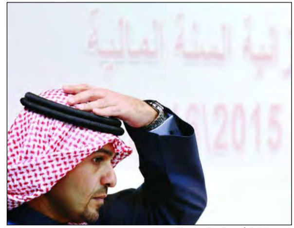
وزير المالية أنس الصالح لحظة الإعلان عن أول عجز بالكويت منذ 14 عاما. سياسات «المالية» التفشيفية السريعة ترفع التضخم وتترك السياسة النقدية