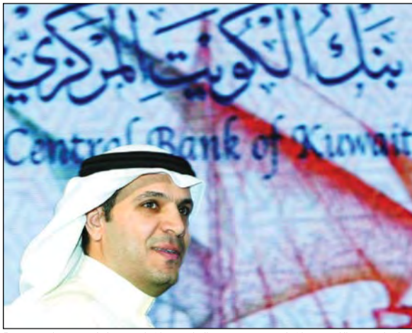
محافظ بنك الكويت المركزي د.محمد الهاشل، «المركزي» أمام تحديات صعبة وسط تغييرات السياسة المالية السريعة

3 الواقع الجديد قد يضغط على البنك المركزي ليراجع عن قرارات سابقة حدثت من قدرة البنوك على الإقراض منها خفض نسبة التمويل العقاري إلى 50% من قيمة العقار بدلا من 75%، كذلك القيود المفروضة على القروض الاستهلاكية التي عرفها المركزي منذ عام فيما عرف بازمة الفواتير والتي أوصلت القروض الاستهلاكية لأدنى مستوياتها منذ 3 سنوات.