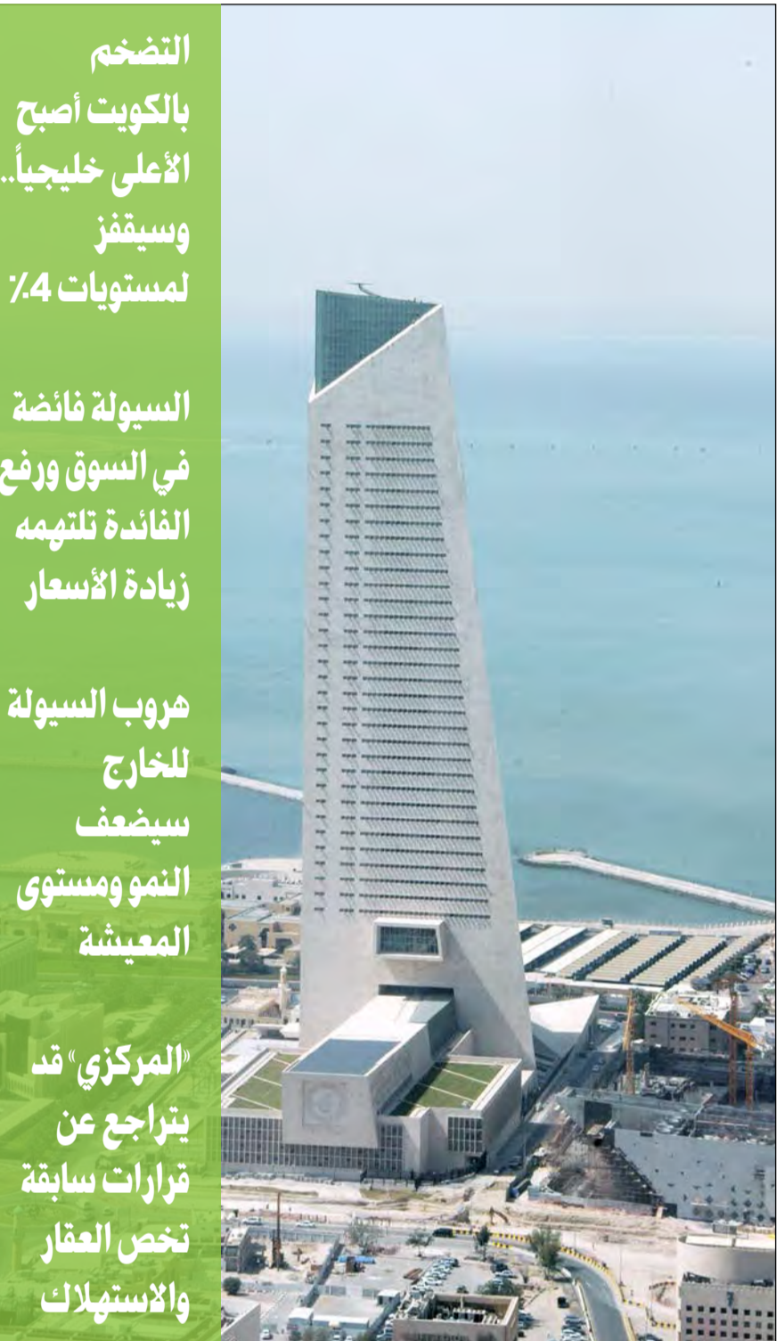
مبنى بنك الكويت المركزي الجديد (محمد هاشم)

10 في ظل هذا الوضع، يفترض أن تعطي وزارة المالية إشارات سريعة لإطلاق برنامج الخصخصة، وتحديد تنفيذ وعدها بخصخصة 4 شركات نفطية وإدراجها بالبورصة، لتأخذ السيولة دورة في الاكتتاب في هذه الشركات. إن هذه التحديات وغيرها قد تدفع البنك المركزي إلى تغيير سياسته المتشددة في الإقراض للعقار والأفراد لمنع حدوث فقاعات وأزمات جاءت من السياسة المالية.