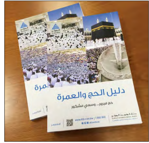
دليل الحج والعمرة

يتضمن أحكام مناسك الحج والعمرة بطريقة مبسطة ومجموعة من الأدعية وإرشادات طيبة ونصائح مهمة للحجاج، مشيرًا إلى أن هذه الهدية تأتي ضمن إطار برنامج البنك الرائد في مجال المسؤولية الاجتماعية الذي يتضمن العديد من المبادرات والأنشطة التي تخدم كل فئات المجتمع. وختم ناجيا مؤكداً سعي «الدولي» الدائم للبقاء على تواصل من عملائه في مختلف المناسبات، وبالأخص عندما تتعلق بالشق الديني والإيماني، انطلاقاً من مسؤوليته الاجتماعية الرائدة كمؤسسة مصرفية تعمل وفق أحكام الشريعة الإسلامية، متمنياً لحجاج بيت الله الحرام أن يجعل الله حجهم مبروراً وسعياً مشكوراً.