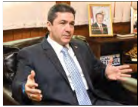
السير التركي مراد تامير (محمد هاشم)

ترتب لزيارة الأمير إلى تركيا مطلع 2017.. وتوقيع اتفاقيات عدة خلال زيارة المبارك قبل نهاية العام 14