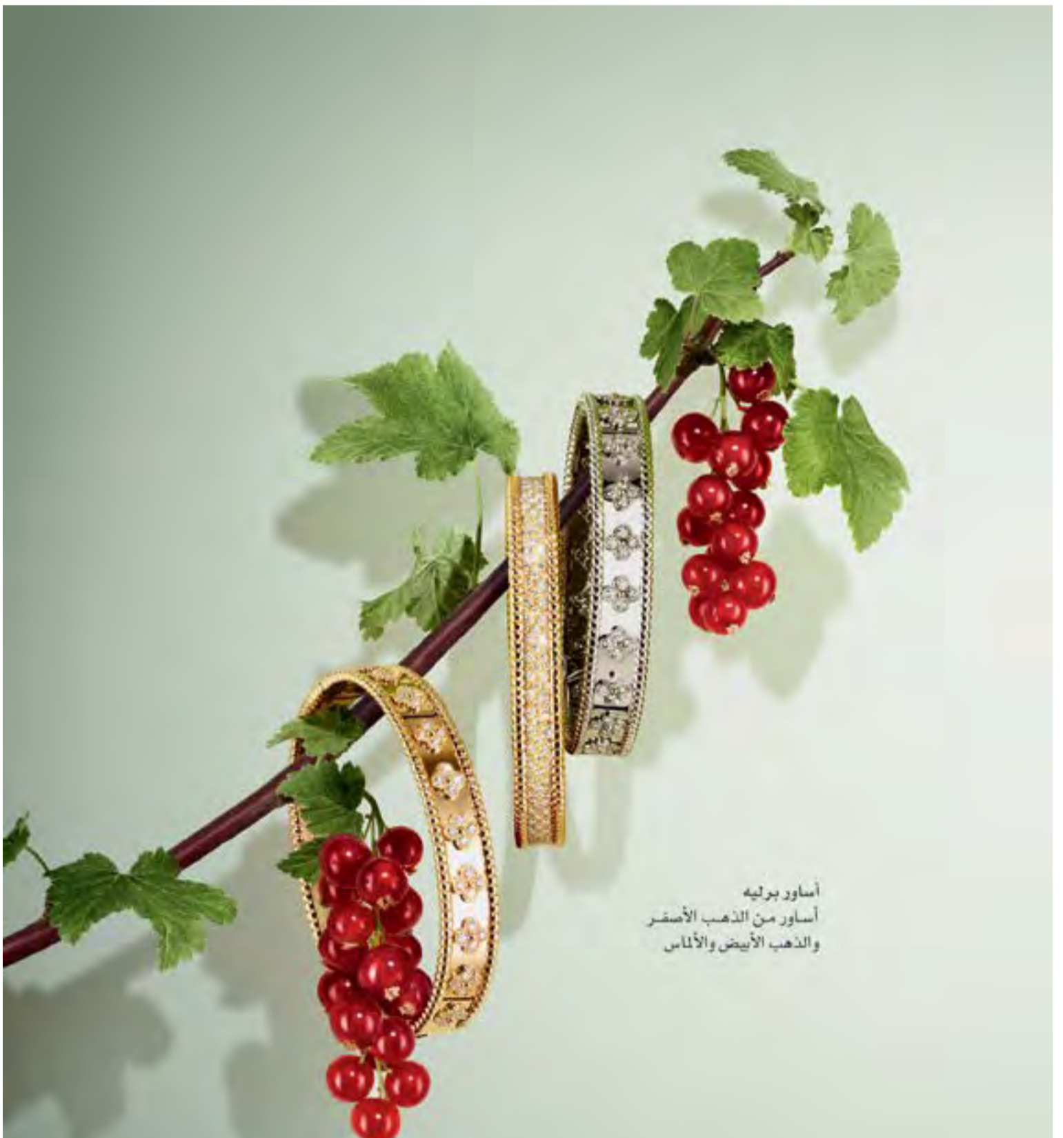
أساور بوليه أساور من الذهب الأصفر والذهب الأبيض والألماس

صنعاء - وكالات: أكدت مصادر عسكرية يمنية أن الجيش الوطني والمقاومة الشعبية وصلوا إلى مشارف قرية محلي بمديرية نهم والخط الرابط بين صنعاء ومارب، بعد السيطرة على الجبال والمرتفعات المطلة على المنطقة. ونشر المركز الإعلامي للقوات المسلحة على حسابه الرسمي عبر موقع التواصل الاجتماعي «تويتر» تسجيلا لضابط في الجيش اليمني، أكد فيه أن القوات الحكومية تقترب من صنعاء، مضيفا: «نقول للناس