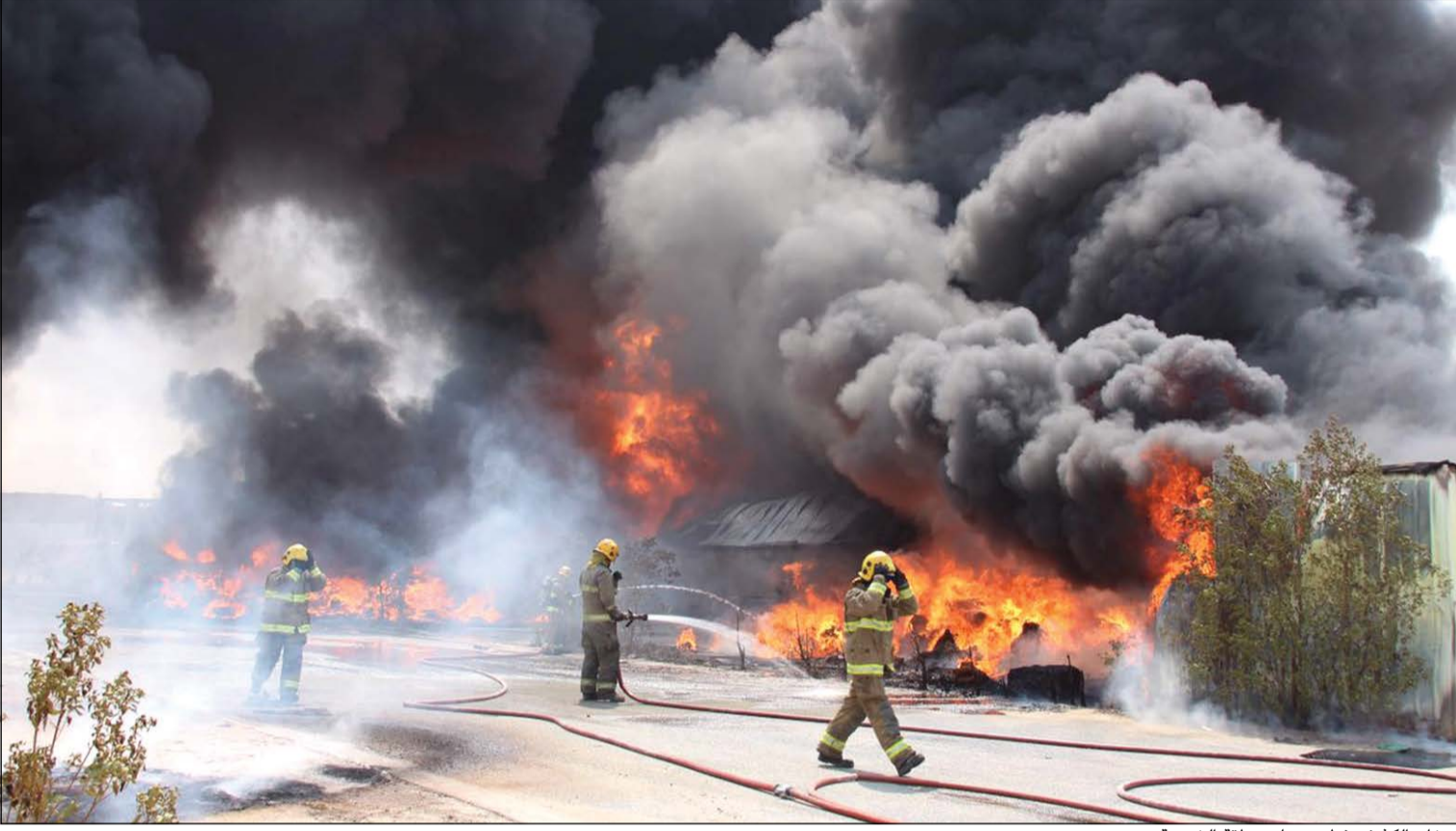
الدخان الكثيف غطى سماء منطقة الشعبية