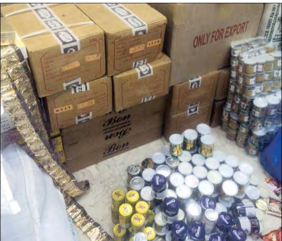
من مضبوطات المخزن

العشوائي تم الاشتباه في وافد بنغالي يحمل كيسا ولدى الطلب منه التوقف حاول الهروب لكن تم توقيفه وبسؤاله عن أسباب هروبه قال إنه يتاجر في علكة لبنان وأنه يقوم بتخزينها في منزل مهجور أرشد عنه رجال الأمن وعثر في المخزن على مواد أخرى يرجح انها غذائية تالفة.