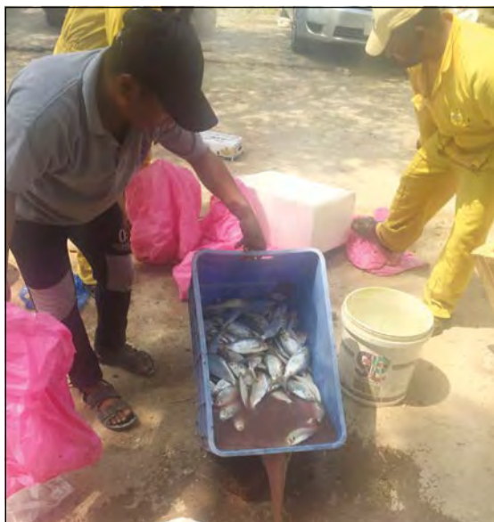
.. وأسماك فاسدة