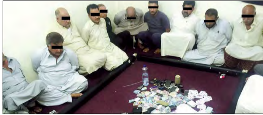
القائمون ضبطوا متلبسين