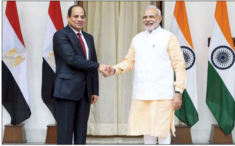
رئيس الوزراء الهندي ناريندرا مودي مرحبا بالرئيس عبدالفتاح السيسي

وأضاف ناريندرا مودي أن مصر والهند حضارتين تملكان تراثا ثقافيا ثريا ولذلك قررنا تعزيز التواصل الثقافي بين الشعبين. وثمن رئيس وزراء الهند جهود مصر في مجلس الأمن الدولي، مشددا على حرص بلاده على تعزيز التشاور مع مصر في إطار الأمم المتحدة بشأن القضايا الإقليمية والدولية لتحقيق المصالح المشتركة بين البلدين، مؤكدا أن مصر والهند اتفقتنا على ضرورة إصلاح مجلس الأمن الدولي ليعبر عن الواقع الحالي. تنفيذ فوري وقد أصدر الرئيس عبدالفتاح السيسي تعليماته