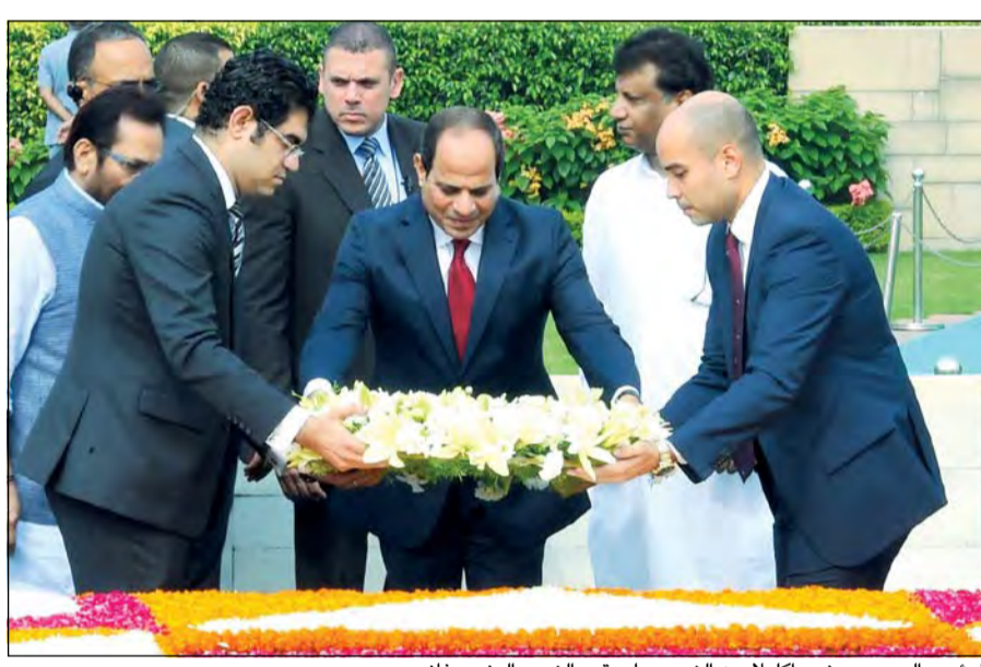
الرئيس السيسي يضع إكليلا من الزهور على قبر الزعيم الهندي غاندي

والخارجي، مضيفا أن مصر جسر طبيعي يربط بين قارتي آسيا وأفريقيا، وأن الشعب المصري يجسد الإسلام المعتدل ويعد دعامة للسلام الإقليمي والاستقرار