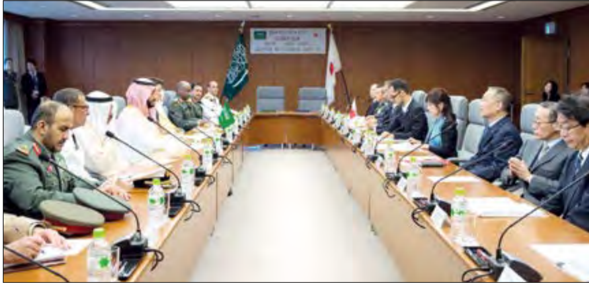
صاحب السمو الملكي الأمير محمد بن سلمان ولي ولي العهد النائب الثاني لرئيس مجلس الوزراء وزير الدفاع السعودي مترسوا وفد المملكة خلال مباحثاته أمس مع وزيرة الدفاع اليابانية

الأوسط تتعرض في الوقت الراهن لمواجهة تحديات صعبة، مثل التطرف وزيادة معدل البطالة في مجتمع الشباب وغيرهما من القضايا، حيث إن استقرار المنطقة يعد أمرا في غاية الأهمية بالنسبة لليابان أيضا، موضحا أنه ضمن هذا السياق ستقوم اليابان بالعمل جنبا إلى جنب مع المملكة العربية السعودية وفقا للمبدأ الرائد الذي يقول إن «خير الأمور أوسطها»، من أجل تحقيق التعايش والازدهار المشترك.