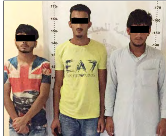
اللصوص الثلاثة من الجنسية السورية