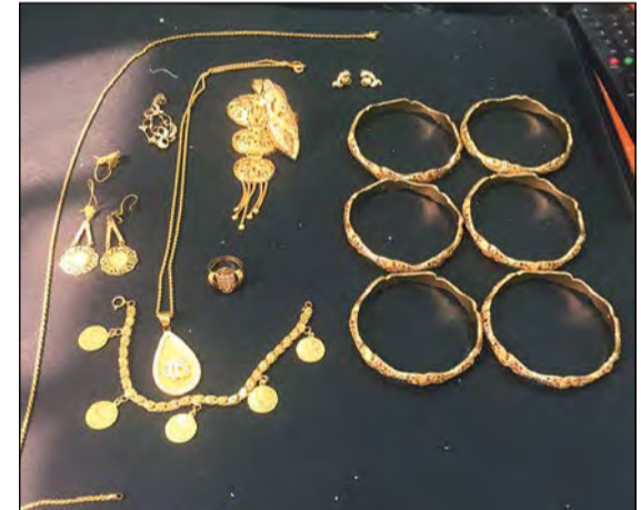
الذهب المسروق من منزل المواطن في الأندلس

على مكان المسروقات، حيث تم عرضها على المجني عليه وتعرف عليها، واعترفوا أيضا بقيامهم بواقعتي سلب بالقوة في منطقتي الفروانية وجليب الشيوخ مقيدين ضد مجهول. هذا وقد تمت إحالة المتهمين والمسروقات إلى النيابة.