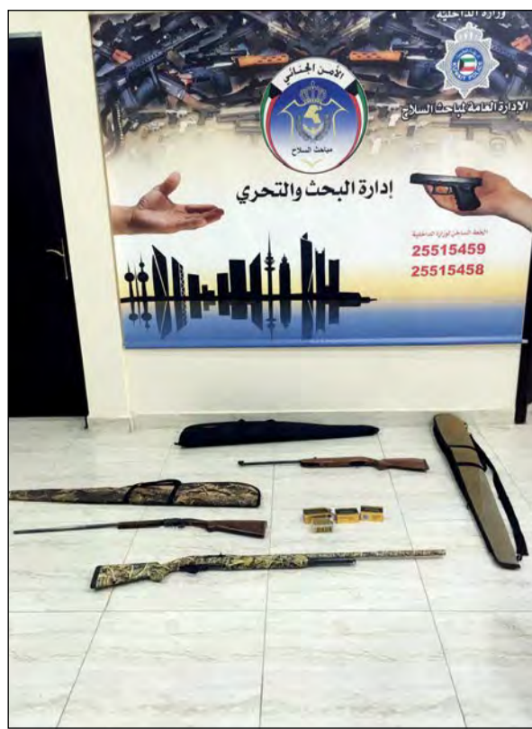
الأسلحة المضبوطة خلال الحملات التفتيشية

نفذت الإدارة العامة لمباحث السلاح يوم امس حملة أمنية في عدة مناطق لضبط الأسلحة والذخائر غير المرخصة وحائزها استنادا إلى نص المادة الأولى من القانون 6/2015، وأسفرت الحملة، التي انطلقت في الثانية عشرة من فجر امس واستمرت إلى ساعات الصباح الأولى وشملت نقاط التفتيش طرق الصبية والسالمي ومنطقة الشاليهات الجنوبية، عن ضبط 12 مطلوباً ومخالفين، وشخصين بحوزتهما سلاحين غير مرخصين فيما ضبط 5 أشخاص مطلوبين على ذمة قضايا مدنية وشخصين اشتبه حيازتهما مواد مخدرة فيما احتجز آخران للاشتباه بهما، وقد تمت إحالة جميع الموقوفين إلى جهات الاختصاص لاتخاذ الإجراءات المناسبة بحقهم.