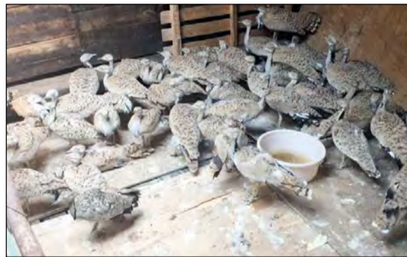
ضبطية الصقور والحباري هربت داخل سفينة إيرانية

ذكرت الإدارة العامة للعلاقات والإعلام الأمني ان رجال الإدارة العامة لخفر السواحل تمكنوا صباح امس من ضبط سفينة إيرانية تحمل 16 صقرا و 100 طير حباري. وأضافت الإدارة أنه بإشراف مباشر من وكيل وزارة الداخلية المساعد لشؤون أمن الحدود البحرية اللواء زهير النصرالله قامت الإدارة العامة لخفر السواحل في التاسعة من صباح امس بحملة تفتيش لسفن النقل الأجنبية القادمة من خارج المياه الإقليمية والمتوجهة إلى ميناء الدوحة، حيث تمكنت من ضبط سفينة تحمل العلم الإيراني قادمة من ميناء قيناوا وبعد تفتيشها عثر بمخابئها على 16 طيرا جارحا من الصقور و 100 طير حباري، مخالفين بذلك قوانين الدولة وقد تم تحويل السفينة والمضبوطات إلى جهات الاختصاص.