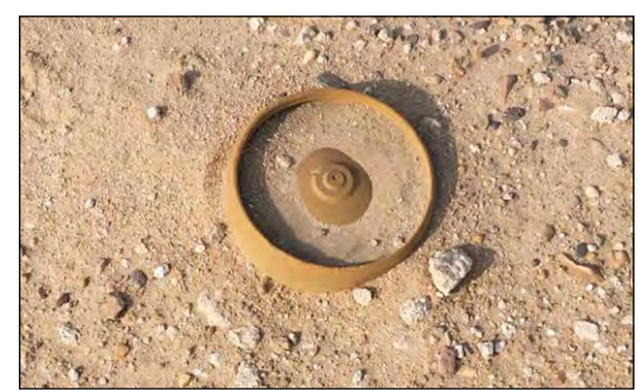
اللغم من مخلفات الغزو

بامر وكيل نيابة الاحمدي، جرى تسجيل قضايا بحق اب سبتيني وزوج خمسيني باعداءه بالضرب وتهديد وحبس حرية، وجاءت هذه القضايا وعلى اثرها جرى استدعاء المدعي عليها، بعد ان تقدمت سيدة من مواليد 1981 وقالت انها تعرضت لحجز حربية على مدار 4 ايام داخل غرفة أشبه بالحبس الانفرادي