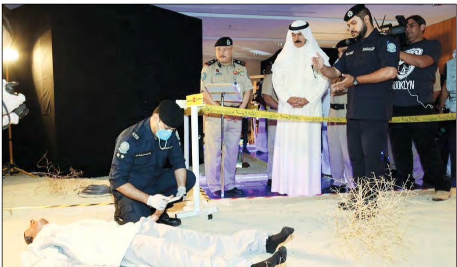
الشيخ محمد الخالد وإلى جواره اللواء شهاب الشمري يتابعان جانباً من تمرين الأمن العام