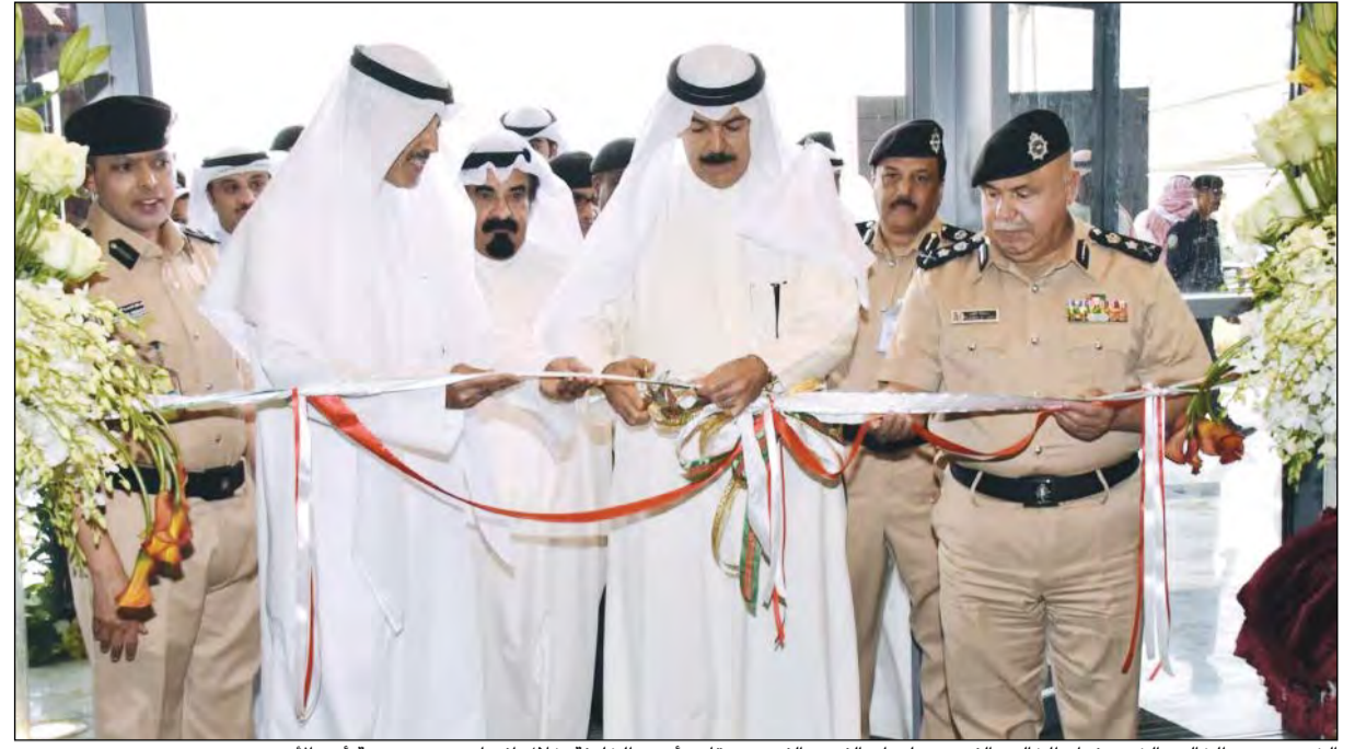
الشيخ محمد الخالد والشيخ فواز الخالد والفريق سليمان الفهد والفريق متقاعد أحمد الخليقة خلال افتتاح مبنى مديرية أمن الأحمدى