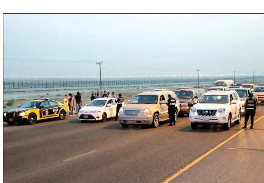
من حملة النجدة التي شملت المحافظات الست

محمد الجلامنة - عبدالله قنيس نفذت إدارة عمليات النجدة حملات أمنية مفاجئة مساء أول من أمس شملت جميع محافظات الكويت. وقالت الإدارة العامة للعلاقات والإعلام الأمني إن هذه الحملات أسفرت عن ضبط 136 مخالفاً ومطلوباً، حيث تبين أن 24 منهم كانوا مطلوبين على ذمة قضايا مدنية، فيما 31 مسجلاً بحقهم قضايا تغيب، وأوقف 45 لعدم حملهم إثبات، و23 لانتهاء صلاحية الإقامة، والقبض على 3 مطلوبين في ضبطية مخدرات. كما ألقى القبض على اثنين بحالة غير طبيعية، و5 مطلوبين لإدارة الإقامة، فيما تم ضبط شخص واحد ومطلوب في قضية نصب واحتيال، وآخر مطلوب للحبس ستة أشهر، وثالث مطلوب للحبس ثلاثة أشهر،