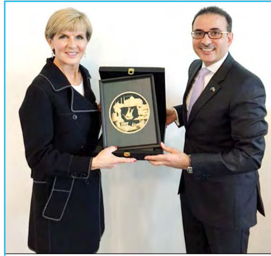
هدية تذكارية من السفير نجيب البدر لوزيرة خارجية أستراليا جولي بيوشوب

كما بعث سمو ولي العهد الشيخ نواف الأحمد وسمو رئيس مجلس الوزراء الشيخ جابر المبارك ببرقيتي تهنئة مماثلتين.