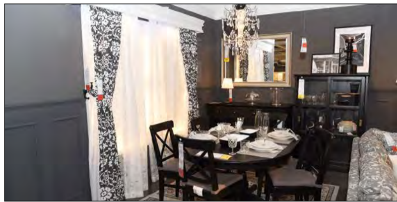
طاولات طعام متميزة