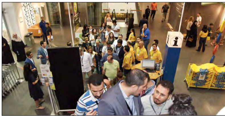
عدد من الحضور في معرض إيكيا