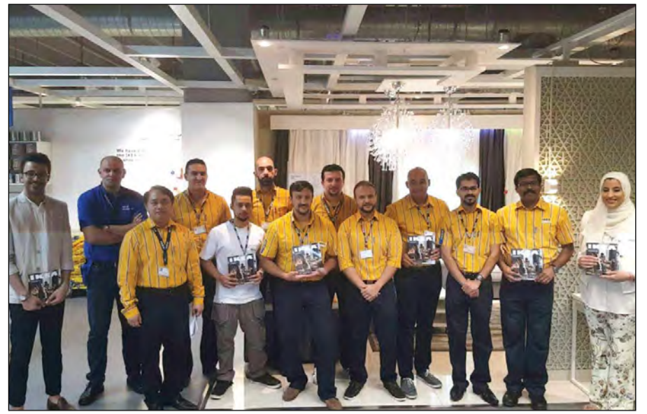
فريق عمل «إيكيا» يحملون الكتالوج الجديد