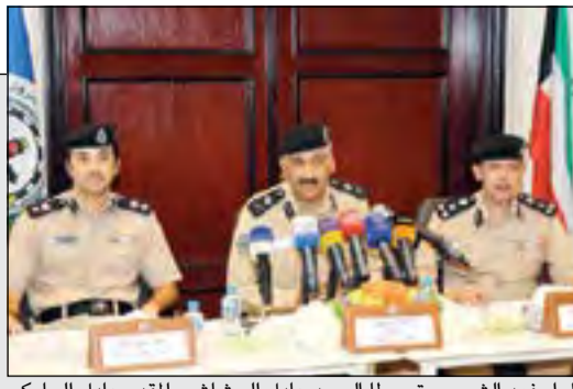
الواء فهد الشويح متوسلا معيد عادل الحشاش والمقدم عادل الجابري