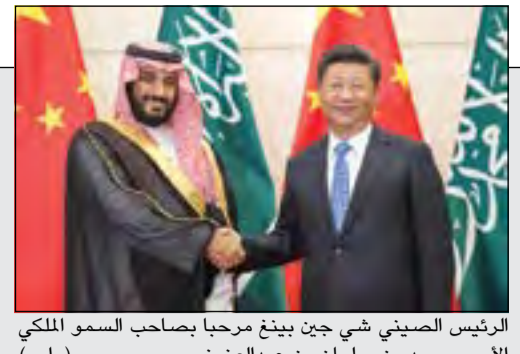
الرئيس الصيني شي جين بينغ مرحبا بصاحب السمو الملكي الأمير محمد بن سلمان بن عبدالعزيز (واس)

الشويح: تحديد تعرفه سيارات الأجرة والنقل العام يهدف إلى منع استغلال المواطنين والمقيمين