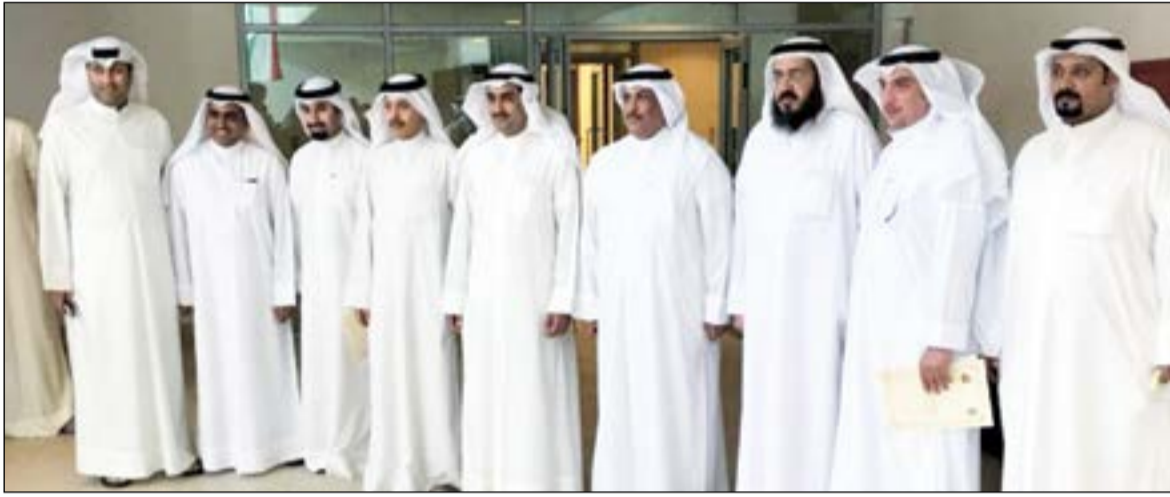
ديوسف العلي متوسلاً مراقبي ومفتشي الرقابة التجارية بطوارئ الصديق

زيادة عدد المفتشين الذين يحملون الضبطية القضائية إلا أن الوزارة تدعمهم لأداء دورهم بشكل أفضل، ومفتشي مركز طوارئ الصديق التابع للوزارة للاستماع إلى وجهة نظرهم فيما يخص طبيعة عملهم خلال الفترة الماضية واستمع إلى خطط حملتهم المكثفة المستقبلية وشجعهم الوزير على بذل المزيد من الجهد، لاسيما أن الانظار زيادة أسعار البنزين للحفاظ على السوق وقياس الأسعار وعدم استغلال البعض لهذه الظروف.