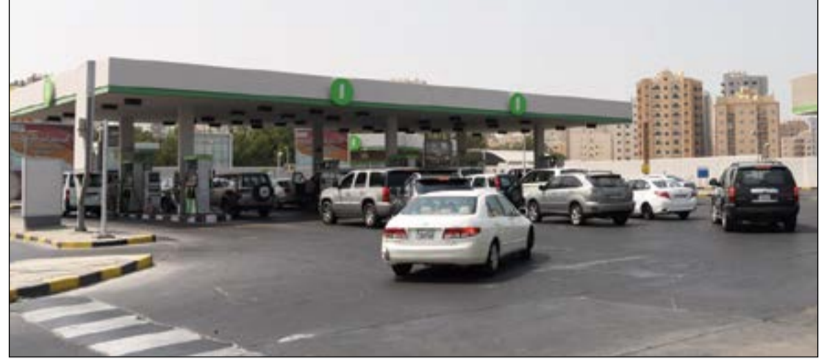
ازدحام نسبي في محطات الوقود قبل يوم من تطبيق الأسعار الجديدة (قاسم باشا)

غير مبرر. وكشف وكيل وزارة الشؤون د.مطر المطيري عن تشكيل فرق تفتيشية في جميع المحافظات ومتابعة ومراقبة الأسعار وتتبعها من وزير الشؤون ووزير الدولة لشؤون التخطيط والتنمية هند الصبيح، وذلك تحسباً لأي استغلال قد يحدث من قبل بعض التجار للزيادة المرتقبة على أسعار البنزين