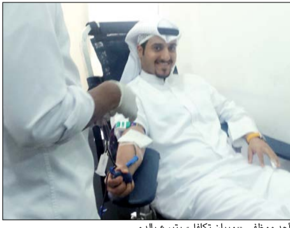
أحد موظفي «بوبيان تكافل» يتبرع بالدم

إلى الكثير من وحدات الدم بهدف إنقاذ حياة الآخرين. وقد شهدت الحملة إقبالاً لافتاً من قبل كل مسؤولي وموظفي الشركة، الذين تسابقوا لتلبية نداء الواجب الإنساني، ترسخا للمفاهيم والقيم الإنسانية النبيلة. وهذه الحملة ليست الأولى التي تنظمها الشركة، حيث تواصل تنظيم الحملات المشابهة تعبيراً عن روح المشاركة الاجتماعية والمسؤولية المجتمعية.