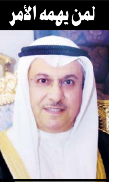
لمن يهيمه الأمر

واحدة؟! لم يرد علي ودخل في نوبة ضحك فهمت منها ان العملية «تضبيب في تضبيب». وأيضا هناك قصة حصلت في أميركا وكنت شاهدا عليها، فقد تم فصل طالب كويتي يدرس في إحدى الجامعات الأميركية فقط لأنه استخدم عدة أسطر من مصدر خارجي لحل واجب من دون ان يشير إلى المصدر الأصلي، و«لبسوه» ثمة خطيرة يكرها الأميركيان وهي «Plagiarism»، وتعني الانتحال العلمي او سرقة أفكار الغير. سبب ذكرى كل القصص السابقة هو وجود فقرة ظالمة وغير عادلة في مقابلات المهندسين المتقدمين للتوظيف في مؤسسة البترول الكويتية، فقد حددت أولوية القبول بعدة نقاط وأعطت معدل التخرج 45% بينما للمقابلة 5% تصورا 5! والباقي لاختبار اللغة الانجليزية والرياضيات. الآن تصور نفسك أحد خريجي جامعة السطوح أو الشبيشة وقد حصلت على 4 نقاط في التخرج (ستكون أغني الأغبيا ان لم تفعل ذلك)، معناها أنت وضعت 45% من نقاط القبول في جييب وكل الذي عليك ان تبذل جهدا قليلا في المقابلة واختبار القدرات وستكون متفوقا على الطالب المتخرج من أقوى الجامعات الأميركية لكن معدله 2,5