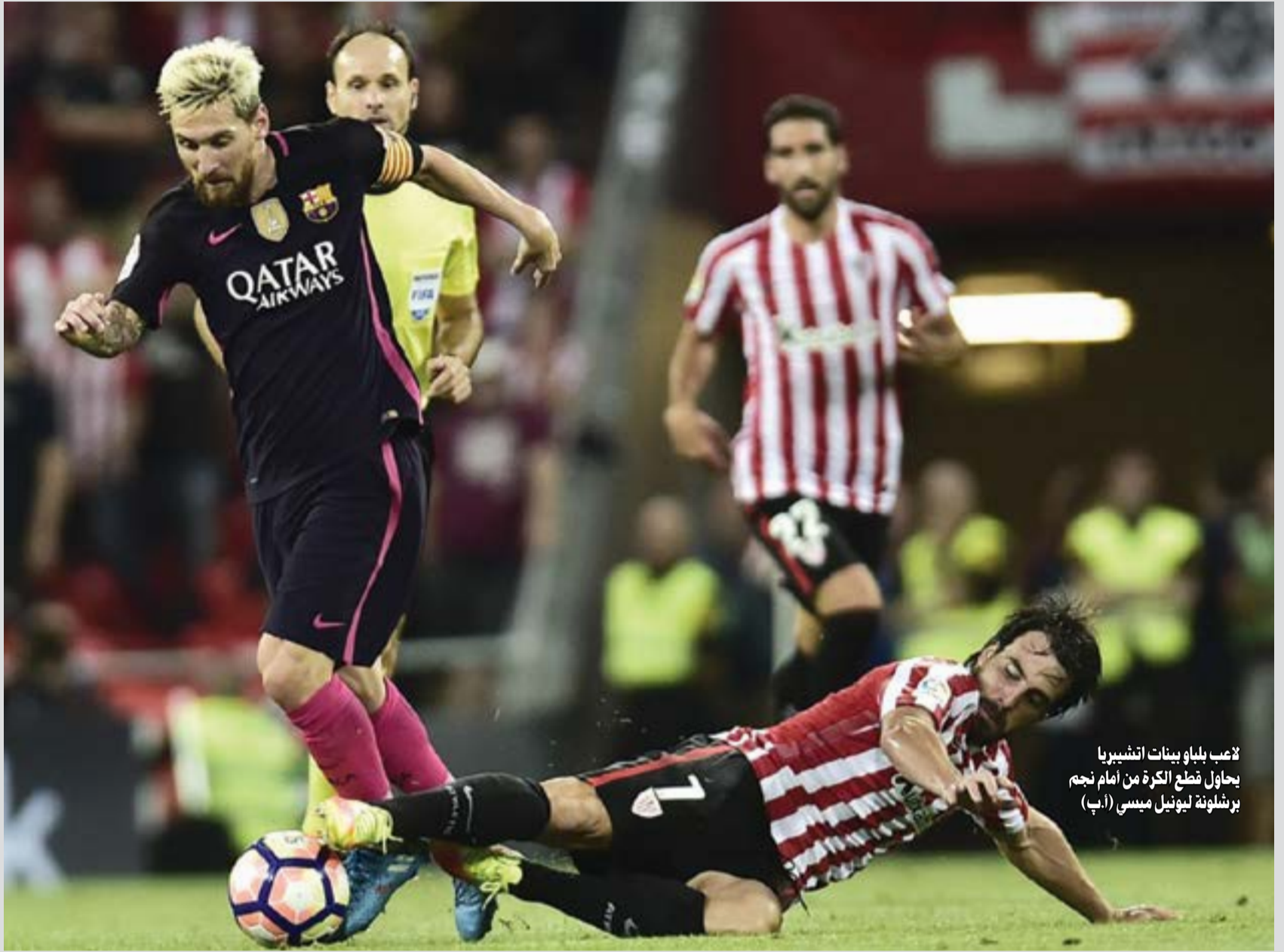
لاعب بلباو بينات اتشيرييا يحاول قطع الكرة من أمام نجم برشلونة ليونيل ميسي

وإحراز اللقب الوحيد الذي كان غائبا عن الخزائن البرازيلية. في المقابل، كانت واضحة تحركات التركي اردا توران والإسباني دينيس سواريز هجوما، والفرنسي صامويل اومتيتي وسيرخيو بوسكيتس دفاعا، فيما مارس لاعبو أتلتيك الضغط على حامل الكرة ونجحوا في الحد من خطورة البطل. وبدأ أتلتيك المباراة بقوة بواسطة عملاقة اريترز ادوريز (35 عاما) في الدقيقة الأولى، وسجل برشلونة هدفا عبر توران لم يحسب لأنه كان في موقف تسلل (6)، ثم كرر ادوريز المحاولة مهددا مرمي الألماني مارك اندريه تير شتيغن الذي ارتكب خطأ قاتلا لم يستغل (9).