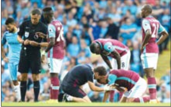
سيرخيو أغويرو متهم بالاعتداء بكوعه على رقبة مدافع وست هام يونايتد وينستون رييد.

كشفت شبكة «سكاي سبورتس» الإنجليزية عن مواجهة الأرجنتيني سيرخيو أغويرو هداف مان سيتي الإنجليزي، لعقوبة الإيقاف في الفترة المقبلة، بعدما أوضحت الإحداث التلفزيونية قيامه بالاعتداء بكوعه على رقبة مدافع وست هام يونايتد وينستون رييد.