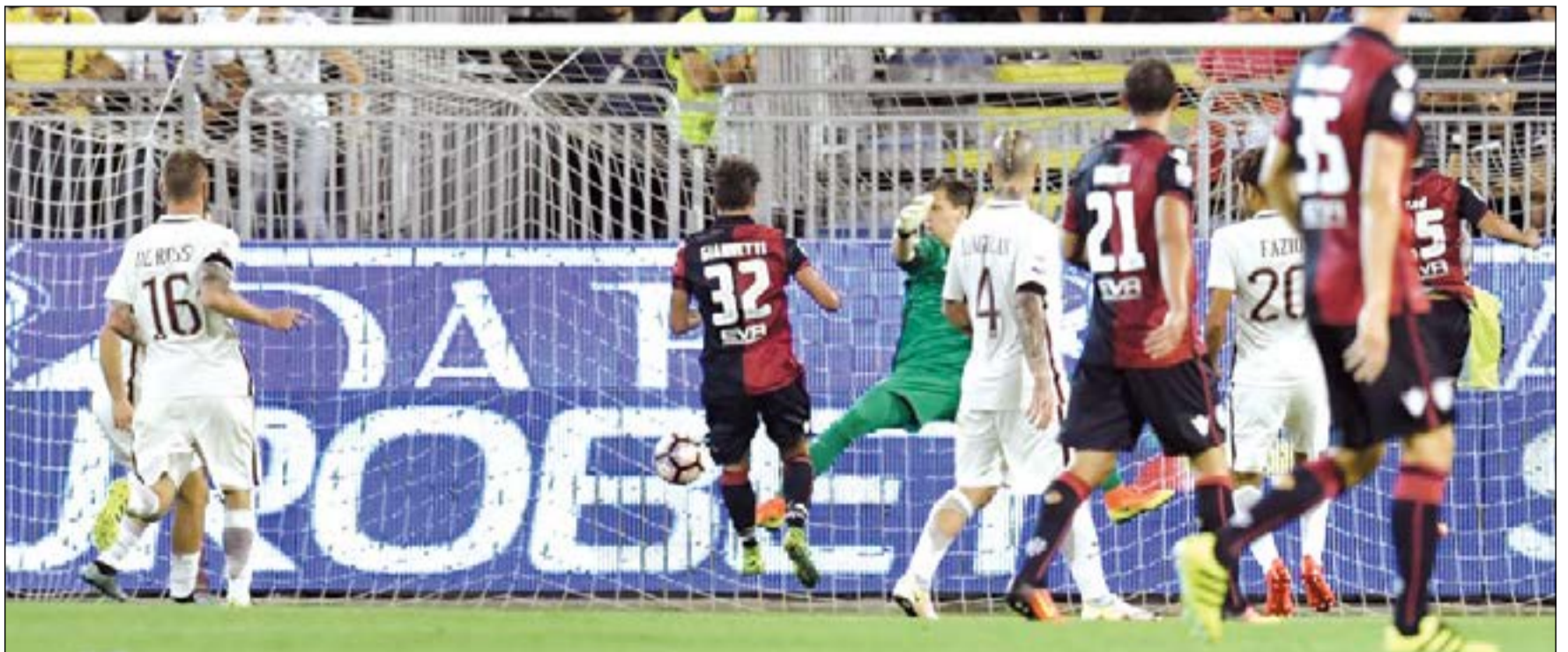
كرة لاعب كالباري ماركو سوفي طريفها لشباك روما

وأحرز الكاسير 25 هدفا في الدوري الإسباني في 51 مشاركة أساسيا في آخر موسمين مع فالنسيا.