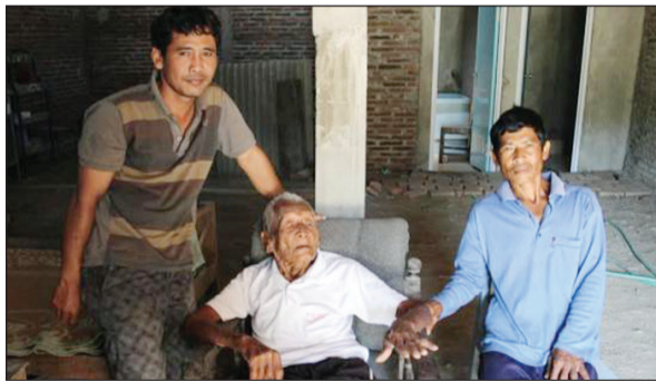
... ومع احفاده

لكن كيف يشعر المرء بعد كل هذا العمر؟ يقول غوتو للإعلام إنه لم يعد راغباً في العيش أكثر: «ما أتمناه هو الموت، فأحفادي جميعهم مستقلون»، أما عن السر وراء العمر المديد، فيصيح: «الوصفة تكمن في الصبر». تجدر الإشارة إلى أن غوتو قد عاش أكثر من أئسابته الـ 10