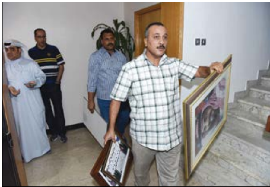
إزالة جميع الصور من على الحوائط في مبنى «الأولمبية».