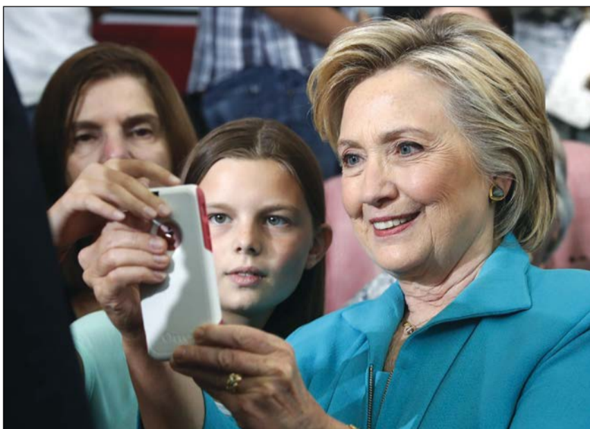
هيلاري كلينتون تتلق صورة سيلفي مع مؤيديها في جامعة رينو أمس الأول

واشنطن- وكالات: أقر طبيب المرشح الجمهوري في انتخابات الرئاسة الأميركية المقبلة دونالد ترامب بأنه كتب تقريره الذي أكد فيه أن ترامب سيكون «أكثر الرؤساء صحة على الإطلاق» في خمس دقائق.