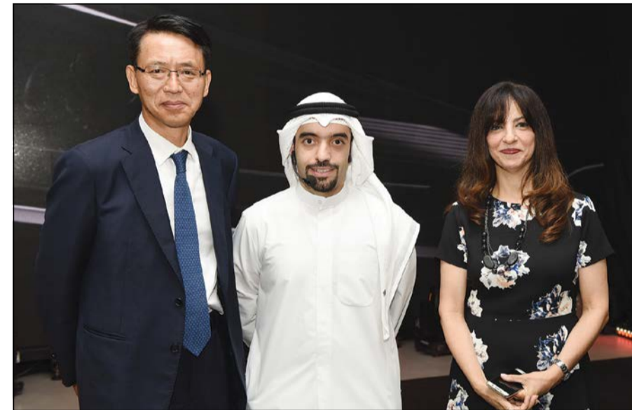
مهند الطوع متوسطة نادية جبران وسون تام لي