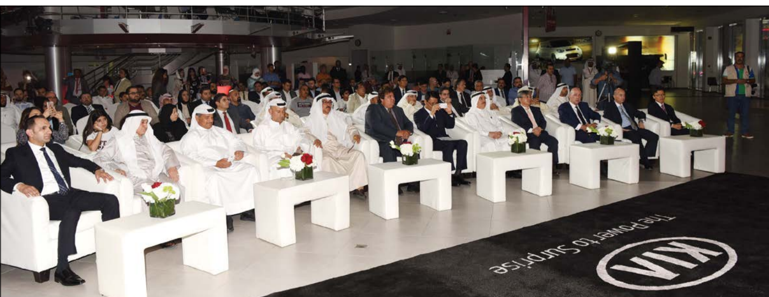
حضور مميز خلال حفل إطلاق كيا «كادينزا»

صممت السيارة في كاليفورنيا لتأسس مرحلة جديدة من معايير تصميم السيارات