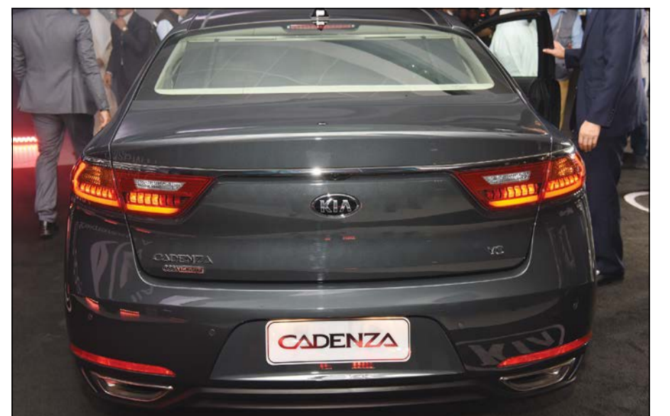
مظهر خلفي لتحفة كيا الجديدة