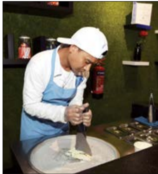
لذة الأيس كريم بعد التجربة الثلجية