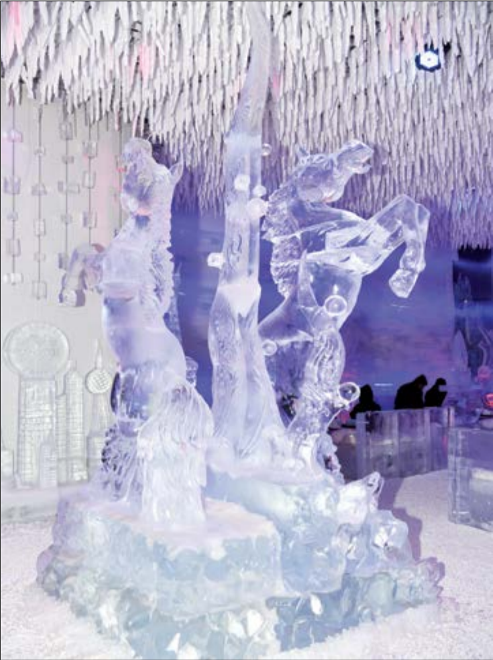
من المنحوتات الثلجية

قبل فريق عمل مدرب، بالإضافة لمتعة الاطلاع على 23 منحوتة ثلجية بأشكال مختلفة وفنية جميلة نحتت داخل الكويت على يد نحاتين عالميين. وزادت قمتنا بعمل دعاية بسيطة داخل الكويت ونطمح لأن نوسع قنوات الدعاية لنصل لكل شرائح المجتمع وبمختلف البلاد، ولمن يرغب في زيارة الكافيه، فسعر التذكرة للكبار 15 د.ك والصغار 10 د.ك، ويستمتع باجواء القطب الشمالي لمدة 45 دقيقة مع تصوير وموسيقى ومشروب، وتخصيص تلك المدة فقط للحفاظ على صحة الزائرين، حيث ان جسم الإنسان بعد 45 دقيقة يبدأ اطرافه تتجمد ولكن فنحن نتبع هذه المقاييس والإرشادات، لافتة الى ان هناك خططا مستقبلية لتوسيع في بلدان اخرى بالإضافة لبرامج جديدة في فرع الكويت تختلف بين فصلي الصيف والشتاء.