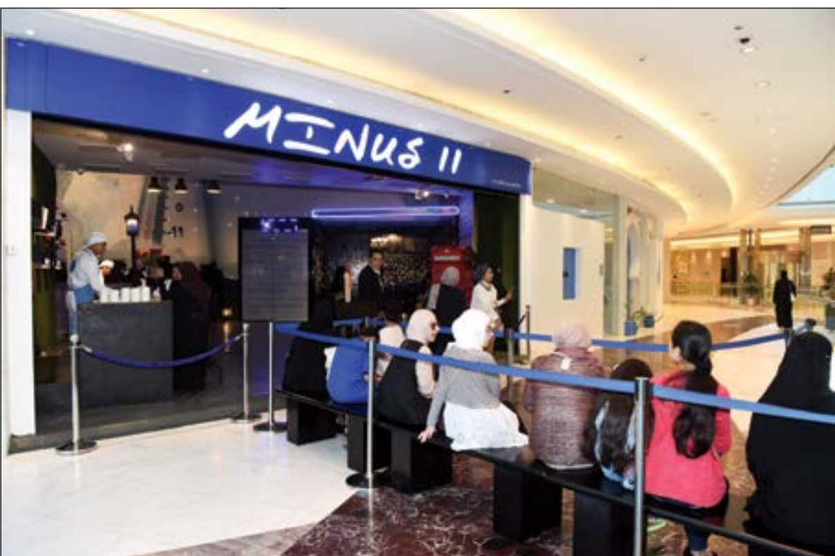
في انتظار خوض التجربة