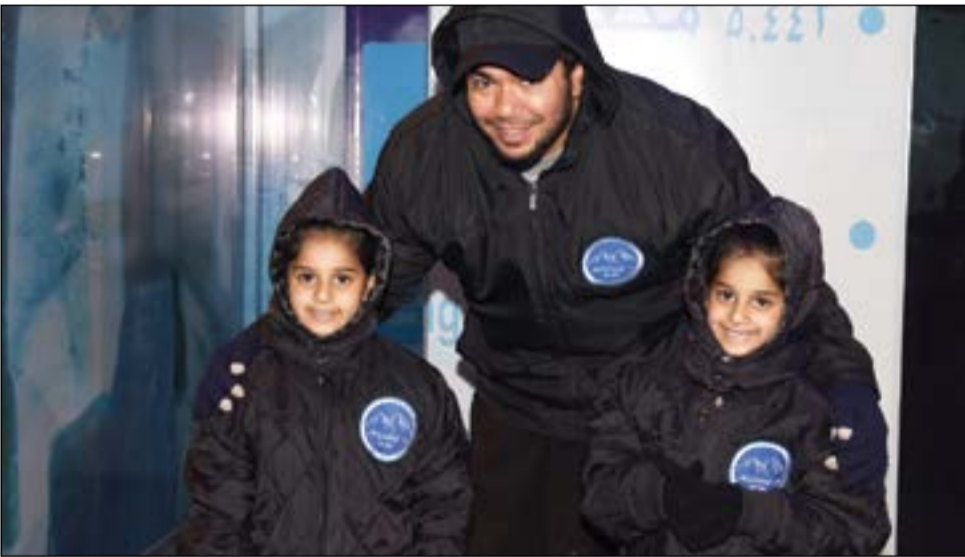
من زوار الكافيه