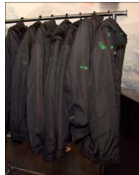
الأزياء المخصصة لدخول الكافيه