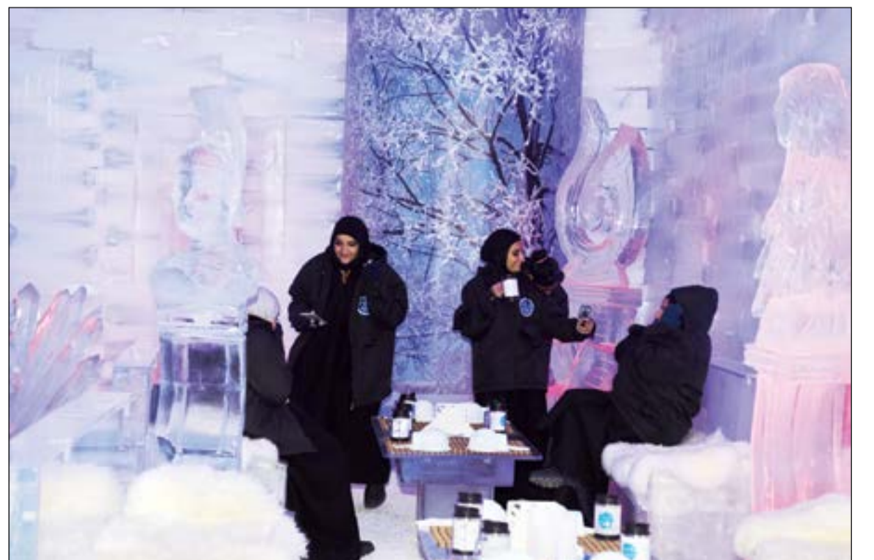
تجربة غير في «Minus 11»