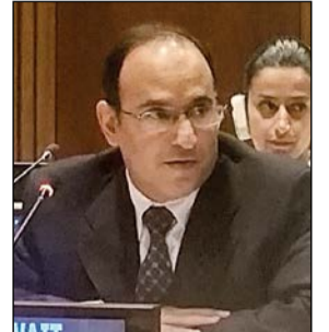
السفير منصور العتيبي

واشنطن - كونا: أعلنت مجموعة آسيا والباسيفيك دعمها ترشح الكويت لعضوية مجلس الأمن للفترة ما بين 2018