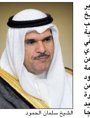
الشيخ سلمان الحمود

نعى وزير الإعلام ووزير الدولة لشؤون الشباب الشيخ سلمان الحمود مدير مكتب صحيفة «الأهرام» المصرية في الكويت الكاتب الصحافي محمد يسري موفى الذي وافقه المنية فجر أمس عن عمر يناهز 47 عاماً إثر أزمة قلبية مفاجئة. وأعرب الحمود في تصريح صحافي عن خالص تعازيه وتعازي أسرة الفقيد الكويتي في الفقيد الراحل الذي كان نموذجا