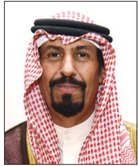
السفير الشيخ علي الخالد

أن المحقق العسكري العقيد بحري بشار عبد الرضا قام بالتواصل مع طلاب البعثة العسكرية المدربين في إيطاليا، مؤكداً سلامتهم جميعاً لاسيما أنهم يتدربون في جنوب إيطاليا بعيداً عن مركز الزلزال الذي وقع في إقليم بوسو إيطاليا، مشيراً إلى أن وفوداً من السفارة تقوم بجولات على المستشفيات ومراكز الإسعاف التي يعالج بها المصابون من ضحايا الزلزال للتحقق أكثر مما إذا كان بينهم مواطنون كويتيون. وجدد التأكيد على تضامن الكويت قيادة وشعباً مع إيطاليا إزاء هذه الكارثة الطبيعية الكبيرة.