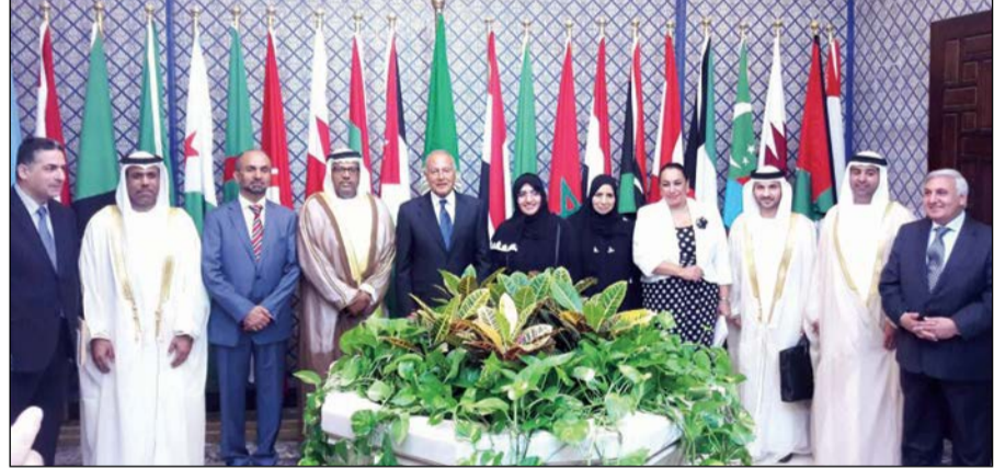
أحمد أبو الغيط متوسلاً أعضاء لجنة برلمان الطفل العربي

اللجنة والمسؤولين القانونيين في الأمانة العامة لوضع تصور النظام الأساسي لبرلمان الطفل العربي. وأكدت أن استضافة الشارقة لمقر برلمان الطفل الدائم، لم يأت من فراغ وإنما جاءت نتيجة الإنجازات الكثيرة التي حققتها إمارة الشارقة خلال الأربعين عاماً الماضية في مسيرتها، خاصة في المجال الاجتماعي، وتأسيس العديد من المرافق الصديقة للطفل والأسرة، واعتماد الأمم المتحدة إمارة الشارقة كأول مدينة في العالم صديقة للطفل. وأوضحت أن تأسيس برلمان الطفل العربي يكتسب أهمية كبيرة في الظروف التي تمر بها المنطقة لخدمة قضايا الطفولة، خاصة أن عدداً من دول المنطقة تعاني من الإرهاب والفقر وتزايد أعداد اللاجئين، وهذه المشكلات تحتاج إلى التركيز عليها من قبل المؤسسات المعنية ومنها برلمان الطفل لتنشئة الأطفال بشكل صحيح، والمستقبل لجيل جديد يكون قادراً على قيادة والتأسيس بامان وسلام بعيداً عن الإرهاب. وقالت إن فكرة هذا البرلمان جاءت إحدى ثمار قمة «سرت» العربية عام 2010، ولكن نظراً للظروف التي مرت بها العديد من الدول العربية منذ عام 2011 وحتى الآن لم يلق هذا البرلمان أي دعم من أي دولة.