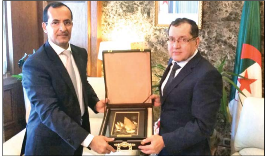
السفير محمد الشبو خلال لقائه وزير الطاقة الجزائري نور الدين بوطرقة

وزير النفط بالوكالة أنس الصالح، مشدداً في هذا الصدد على أهمية منتدى الطاقة الدولي المقرر أن تستضيفه الجزائر في 26 سبتمبر المقبل بمشاركة الدول الأعضاء في منظمة الدول المصدرة للنفط «أوبك» وخارجها. وأكد الشبو متانة العلاقات التي تجمع بين الكويت والجزائر وسعيهما المشترك لتطويرها في شتى المجالات لاسيما النفطية، موضحاً أن مباحثاته مع الوزير الجزائري تركزت على عدد من القضايا ذات الاهتمام المشترك ومنها موضوع الطاقة وسبل تعزيز التعاون بين البلدين في هذا المجال. وأعرب عن ارتياحه لمستوى العلاقات «المتميزة» بين البلدين الذين يتطلعان لفتح آفاق أرحب للتعاون الثنائي في مختلف المجالات.