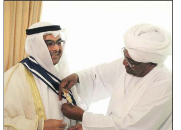
البشير يقبل الهاجري وسام النيلين من الطبقة الأولى