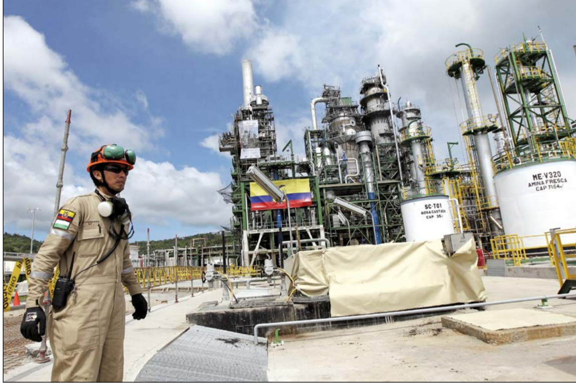
تقاول يطغى على اجتماع الجزائر وسط تصريحات سعودية وروسية تلح بالتدخل لإعادة التوازن في السوق وفي الصورة عامل امام إحدى مصافي الأكوادور (رويترز)

وكالات: تتربق الأسواق الاجتماع المزمع انعقاده في الجزائر في 26 إلى 28 سبتمبر مع تكهنات متزايدة بخصوص إمكانية تجديد الإنتاج وسط تصريحات سعودية وروسية تلح بالتدخل لإعادة التوازن في السوق.