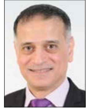
إعداد: د. طارق البكري