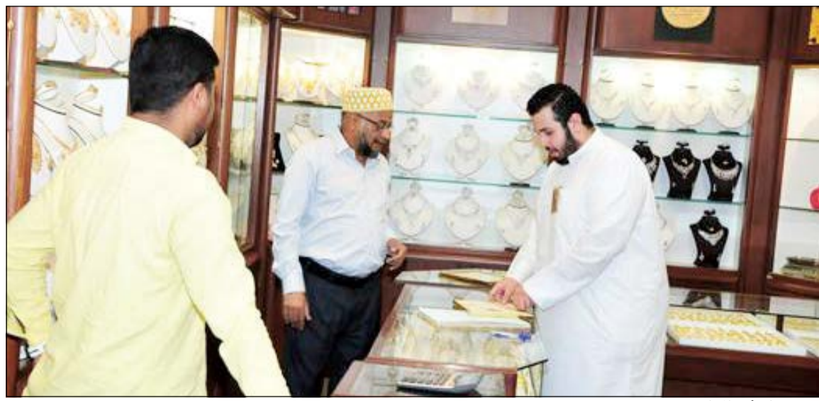
تفتيش على أحد المحال