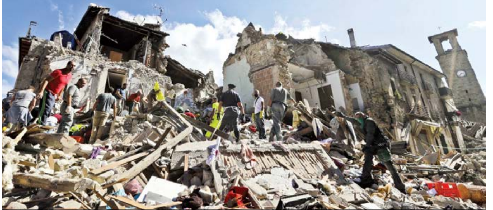
تدمير شامل وسط إيطاليا

ابراهيم جبرا شحير - 86 عاما - صباح السالم - ق 6 - ش 1 - ج 1 - م 52 - ت: 25518092