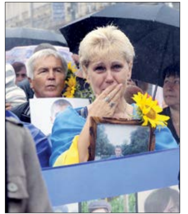
بكاء على الضحايا

أكدت سفارتنا لدى إيطاليا سلامة جميع رعايانا الكويتيين المقيمين والمتنقلين بعد الزلزال، وأوضحته السفارة في بيان تلقته «كونا» أنها تتواصل مع جميع المواطنين المقيمين من أعضاء البعثة والمكاتب الكويتية والعاملين والمتنقلين في إيطاليا بمن فيهم الطلبة العسكريون والرحمة والمصابين سرعة الشفاء وأن يتمكن المسؤولون في البلد الطبيعي، كذلك بعث سمو ولي العهد الشيخ نواف الأحمد وسمو رئيس مجلس الوزراء الشيخ جابر المبارك ببرقتي تعزية مماثلتين إلى رئيس الجمهورية الإيطالية. بينما