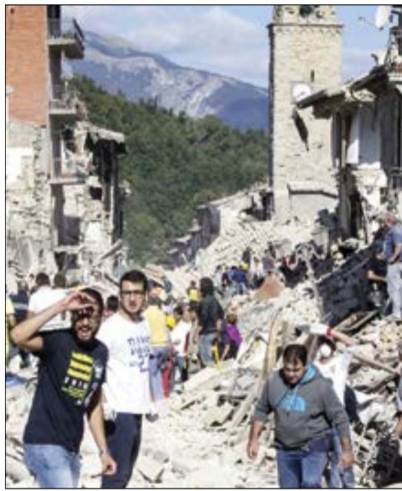
ذهول وسط الركاب

رئيس الوزراء الإيطالي يتعهد بتقديم المساعدات ويشكر كل من ساعد في جهود الإغاثة