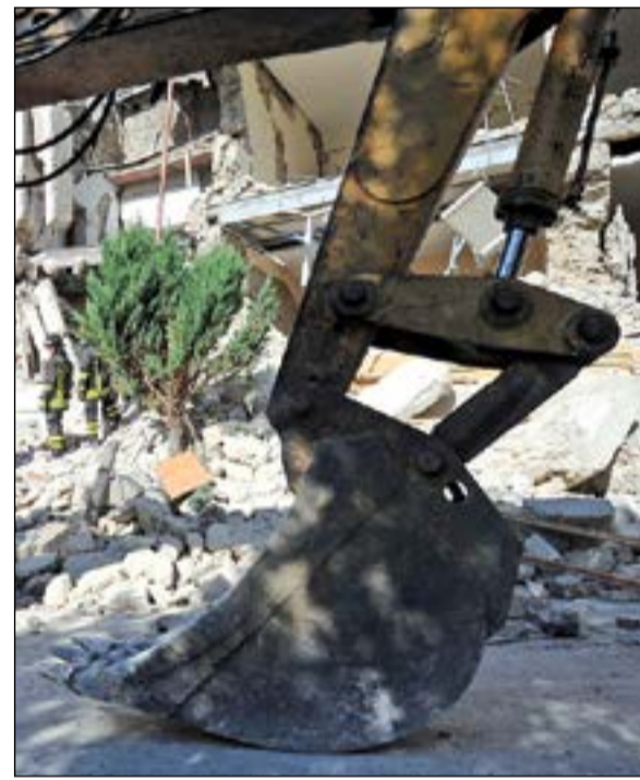
رافعة لرفع الانقاض