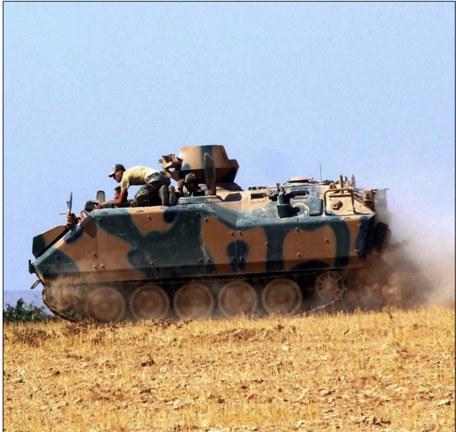
آلية عسكرية تركية تترابط على الحدود مع سورية في كركميش (أ.ب)