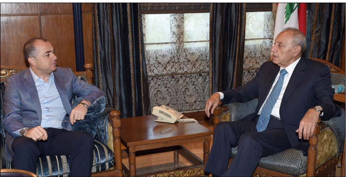
رئيس مجلس النواب نبيه بري مستقبلاً وزير التربية العوني الياس بو صعب (محمود الطويل)

وفي معلومات المصادر المتابعة لـ «الأخبار» أن خط الاعتراض العوني على قرارات وزير الدفاع سيبقى دون الاستقالة، لأن من لم يستقل من مجلس النواب بعد التمديد له أولاً وثانياً لن يجد ما يبرر به استقالته من الحكومة للناس، اعتراضاً على «التمديد» للضباط. وأوضح أن التمديد ستة وثلاثة وأخيرة للعماد جان قهوجي هو ما يقلق الجان ميشال عون، وثمة من يتحدث عن تنظيم التيار تظاهرة احتجاجية دون مقارفة الاستقالة المنعومة، خصوصاً أن حلفاء التيار، وبينهم حزب