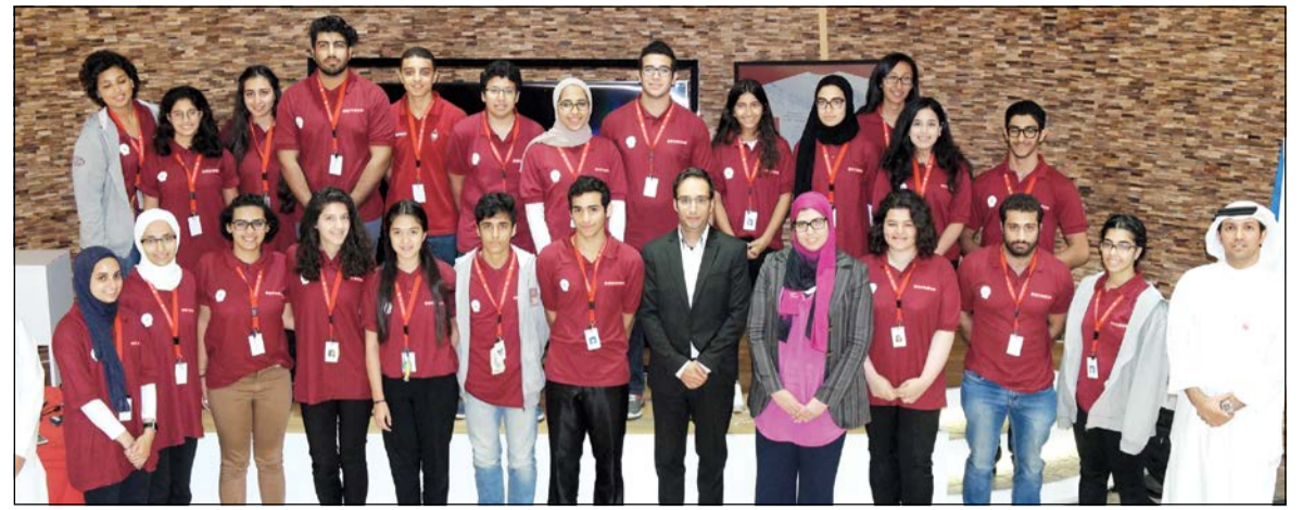
لقطة جماعية للطلبة والمتدربين

وصممت مجموعة حقائب الظهر هذا العام ل تتميز بأربعة أشكال جديدة تجعل التوجه إلى المدرسة مريحاً وأنيقاً، وتضيف مجموعات منتجات الشخصيات المحبوبة مزيداً من التميز والبهجة إلى الحقائب المبطنة، والعبوات المقاومة للصدأ من الفولاذ والتريتان، وإلى علب الطعام لوجبة الغداء المميزة لطفلك، وتتضمن القرطاسية أيضاً مخابر مرحة الأشكال وحافظات الأقلام الصلبة ثلاثية الأبعاد والأقلام المضيئة والملوثة وغيرها، ولا شك أن أحدث تشكيلة من اللوازم المدرسية التي تحمل رسومات مرحة