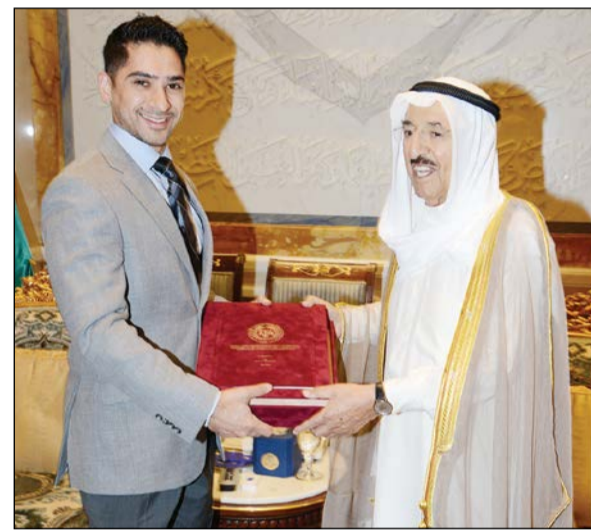
صاحب السمو خلال استقباله د. فهد السناني

سموه رسالة الدكتوراه في مجال «علوم بحار الفيزياء». كما استقبل سموه بقصر بيان صباح أمس الرائد د. خالد العجمي حيث أهدى سموه رسالة الدكتوراه في مجال «الإحصاء».