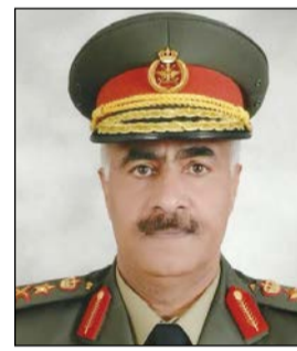
الفريق الركن محمد الخضر

بيان صباح أمس د. محمد الكمي، حيث أهدى سموه رسالة دكتوراه في مجال «علوم بحار الجيوكيمياء». واستقبل صاحب السمو الأمير بقصر بيان صباح أمس د. فهد السناني، حيث أهدى