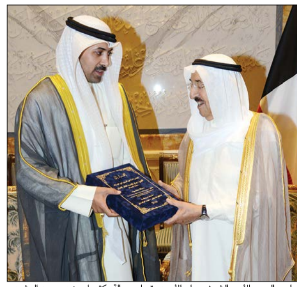
صاحب السمو الأمير الشيخ صباح الأحمد يتسلم رسالة دكتوراه من د. محمد الرشيد