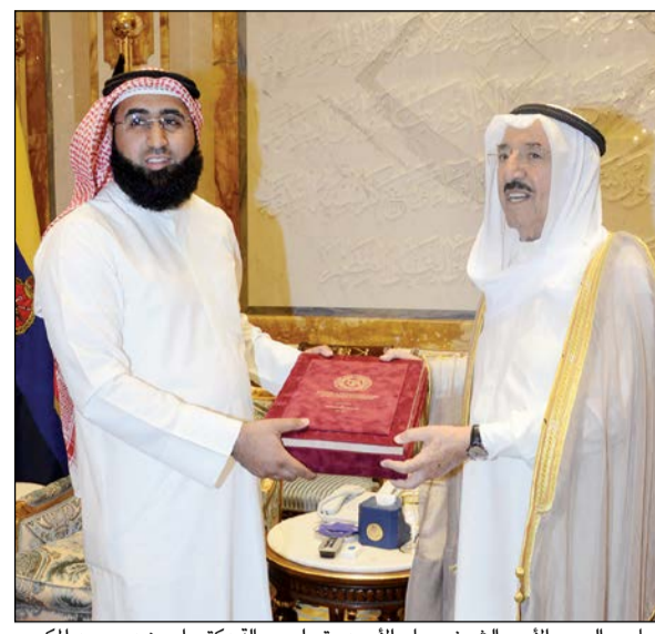
صاحب السمو الأمير الشيخ صباح الأحمد يتسلم رسالة دكتوراه من د. محمد الكمي