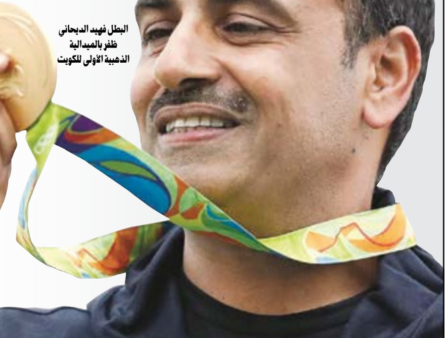
البطل فهد الدبحاني ظفر بالميدالية الذهبية الاولى للكويت

أنهى الرياضيون والرياضيات العرب مشاركتهم في دورة الالعاب الاولمبية وفي جعبتهم غلة «واعدة» لا بأس بها مقارنة مع ما حققوه في تاريخ مشاركتهم السابقة. واللائق في الغلة ان 40٪ منها كان من نصيب السيدات وذلك للمرة الاولى في تاريخ المشاركات العربية. وتميزت الالعاب الاولمبية الاولى في اميركا