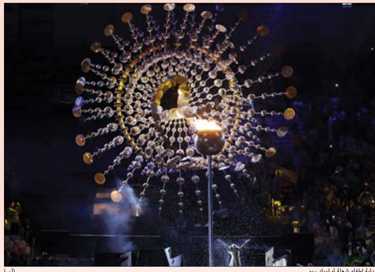
بداية اطفاء شعلة اولمبياد ريو (أ.ب)

مقدمهم الروسية يلينا ايسينباييفا، «قبصرة» القفز بالزانة التي تخيرت احلامها بلقب أولمبي ثالث بسبب حرمانها من المشاركة على خلفية فضيحة المنشطات في الرياضة الروسية. وبعد شكر المتطوعين الذين رافقوا الالعاب، تم تسليم العلم الأولمبي الى المدينة المضيفة التي كان لها الحق خلال دقائق معدومة بتقديم شرح موجز عن الكيفية التي ستكون عليها الالعاب بضيافتها قبل القاء الكلمات الرسمية. وتناوب على الكلام رئيس اللجنة البرازيلية المنظمة لاولمبياد ريو 2016، كارلوس نوزمان الذي شكر الجميع، ورئيس اللجنة الاولمبية الدولية الألماني توماس باخ فكرر وصفه للالعاب في ريو التي شكلت برأيه «النموذج والرمز» الذي طال انتظاره. وأعلن باخ اختتام الالعاب ريو، واطفئت الشعلة في المرجلين: في ملعب ماراكانا وامام كاتدرائية كاندلاريا وسط مدينة ريو.