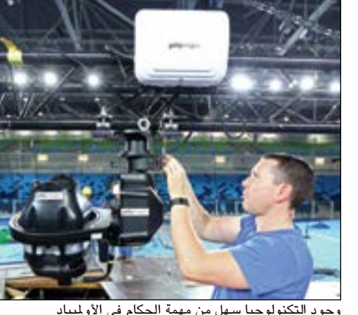
وجود التكنولوجيا سهل من مهمة الحكام في الالبياد