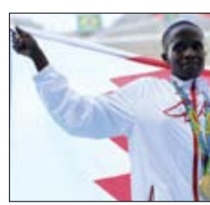
الجري-الجامايكي الاصل اندرو فيشر يدرك جيداً معنى ذلك، بعدما أقصي من نصف نهائي 100 م عندما

من الحفل الذي شهد ايضا التقليد المعتاد في نهاية كل اولمبياد بتتويج الفائزين بسباق الماراتون من الرجال