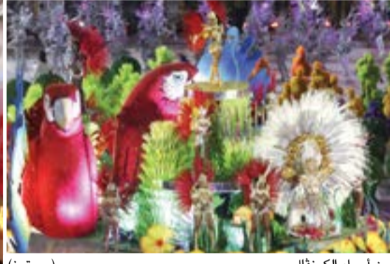
من أجواء الكرنفال