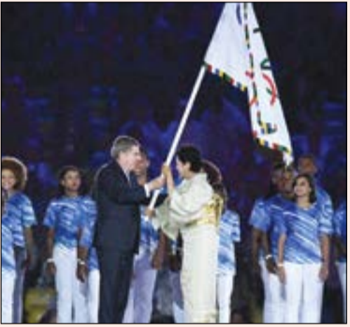
يوريكو كويكي حاكم طوكيو تسلم العلم الأولمبي من رئيس اللجنة الأولمبية الدولية توماس باخ

بحضور الثلاثي، رئيس اللجنة الأولمبية الدولية، الألماني توماس باخ، وإدواردو بايس عمدة ريو دي جانيرو، ويوريكو كويكي حاكم طوكيو، تم إنزال العلم الأولمبي بعد عزف النشيد الرسمي له وتسليمه للحاكمة التي ستستضيف بلادها الحدث الأولمبي الكبير بعد 4 سنوات في «طوكيو 2020». وأعقب مراسم تسليم العلم، عرض فيلم مبهر ظهر فيه السباح الياباني الشهير كوزوكي كيتاجيما بصحبة البطل الكارتوني المعروف «سوبر ماريو»، وهو يصدد شق كوكب الأرض من قلبها حتى يختصر مسافة الوصول من اليابان إلى ريو دي جانيرو في صورة طريفة، قبل أن ينتقل هذا العرض البصري المبهر من الافتراض إلى الواقع بعد أن حل كيتاجيما في ملعب «ماراكانا»، خارجاً من حفرة «سوبر ماريو» المعروفة لعشاق ألعاب الفيديو. وفي بروتوكولات راسخة للألعاب الأولمبية.. أصبح رفع علم اليونان وعزف نشيدها بالإضافة إلى إنزال العلم الأولمبي تقاليد ثابتة في كل حفل اختتام.