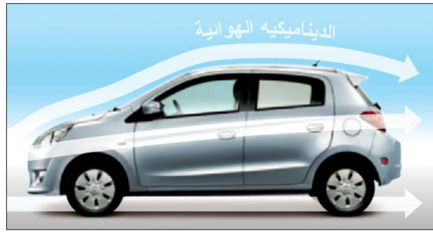
أداء الديناميكية الهوائية