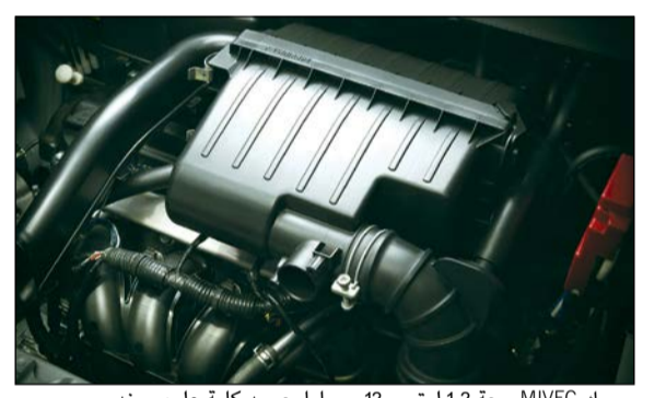
محرك MIVEC 1.2 ليتر و 12 صماما بعمود كامات علوي مزدوج