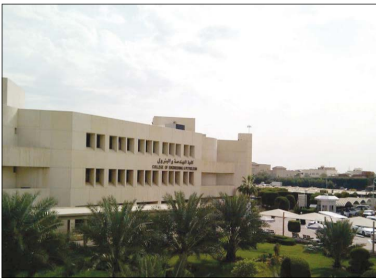
كلية الهندسة بمنطقة الخالدية

تعرض «الأنباء» قائمة أعلى 10 مناطق سكنية في الكويت، وذلك حسب متوسط الأسعار المعلنة للمتر المربع في إحصائيات جهات معتمدة (مثل بيت التمويل الكويتي وبنك الكويت الدولي ووزارة العدل). وتكشف القائمة أن أعلى المناطق السكنية تقع بالقرب من العاصمة، وتتميز عن سواها من المناطق، سواء من حيث القرب من مراكز الخدمة الرئيسية داخل العاصمة، مثل (مجمع الوزارات، البنوك، شركات الاستثمار) أو تنظيمها الداخلي ورحابة شوارعها أو مساحة بيوتها. كما تمتاز هذه المناطق عادة بالقصور الفخمة التي غالباً ما تكون مهجورة معظم أيام السنة (وبخاصة في موسم الصيف والإجازات)، بينما يسكن ملاك هذه القصور في أرقى العواصم العالمية مثل لندن ونيويورك وسويسرا. ويبدأ متوسط سعر المتر المربع في هذه المناطق من 950 دينار ويصل إلى 2000 في أغلها، بمعنى أن تكلفة سعر البيت الجديد الذي تبلغ مساحته 1000 متر مربع لن يقل عن مليون دينار، وسيصل إلى مليوني دينار وربما أكثر.. إذا ما أخذنا بعين الاعتبار الموقع والارتداد والخدمات القريبة منه. وفي ما يلي قائمة أعلى 10 مناطق سكنية في الكويت (من الأعلى إلى الأخص) مع ذكر مميزات كل منها، وذلك على النحو التالي: