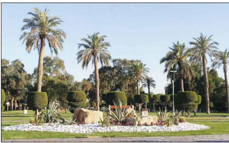
حديقة جمال عبدالناصر بمنطقة الروضة

تمتاز هذه المنطقة كذلك بقربها من العاصمة الكويتية، كما أنها تمتاز بهيوئها الشديد وشوارعها الواسعة، وتضم الشامية دواوين رئيسية منها على سبيل المثال ديوان (المرزوق، الخرافي، الشايح، الطريجي).