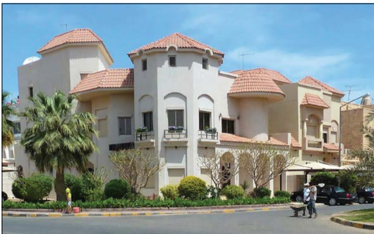
بعض المنازل الراقية بمنطقة كيفان

هذه المنطقة فيها 3 قطع سكنية وبالتالي فإنها تضم عدداً قليلاً من البيوت، وتمتاز بقربها من العاصمة ويحيط بها مجموعة من المناطق الراقية مثل الفيحاء والعديلية وضاحية عبدالله السالم والروضة.