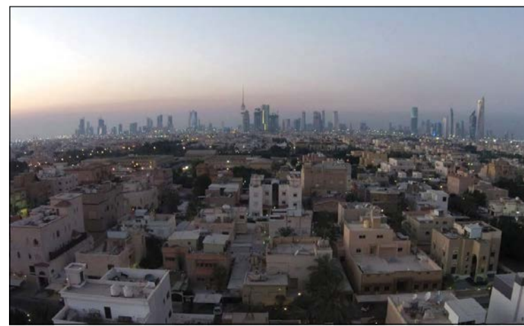
لقطة عامة لمنطقة النزهة

، وتعتبر هذه المنطقة من أكثر المناطق ثباتاً في الأسعار خلال السنوات الخمس الأخيرة، كما أنها تشتهر بوجود حديقة جمال عبدالناصر، علماً بأن هذه المنطقة تتوسط مجموعة من المناطق المرغوبة للسكن.