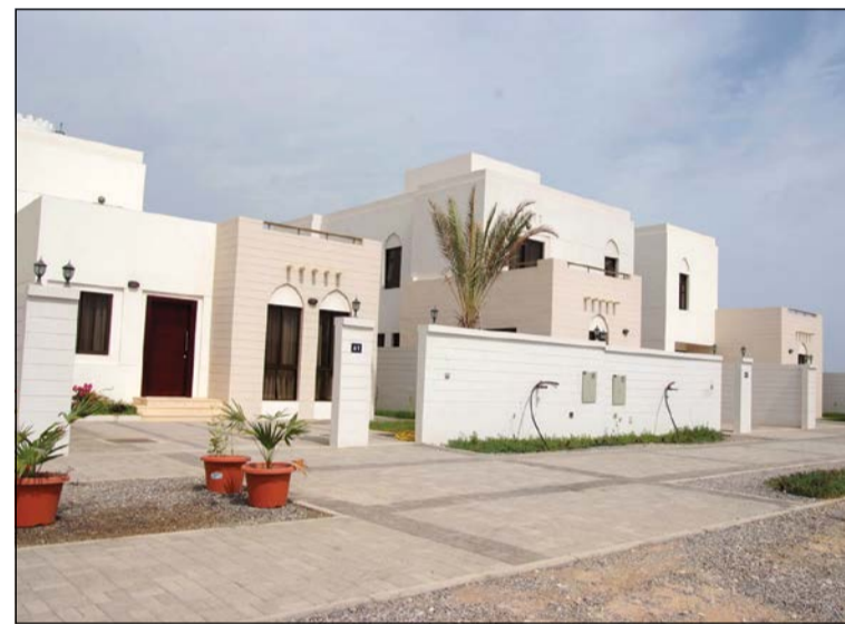
تمتاز منطقة الشويخ السكنية بالقصور والظل الفخمة ما جعلها الأعلى سعرا بالكويت

تمتاز هذه المنطقة بأن أغلب بيوتها كبيرة المساحة وبها ارتدادات كبيرة جداً، فضلاً عن رحابة شوارعها الداخلية، لكن ما يسيء إلى هذه المنطقة هو وجود جامعة الكويت داخلها، مما يجعلها تحتفظ بالسيارات أثناء فترة الدوام الرسمي.