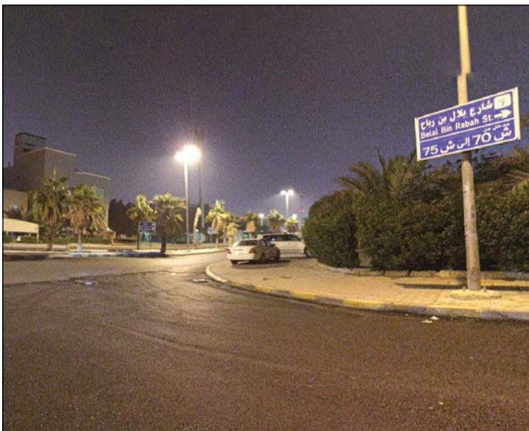
شارع بلال بن رباح بمنطقة الفيحاء

تحتوي على قطعتين «ا و ب» الأعلى في الكويت، وتمتاز هذه المنطقة بأنها منطقة الأثرياء الكويتيين، وتمتاز بمساحات بيوتها الواسعة، وهي في الوقت نفسه منطقة غير مزدحمة، إذ لا يزيد عدد البيوت فيها على الـ 500 بيت، ونادراً ما تشهد هذه المنطقة تداولات عقارية على بيوتها بسبب محدوديتها وتمسك أصحابها بها.