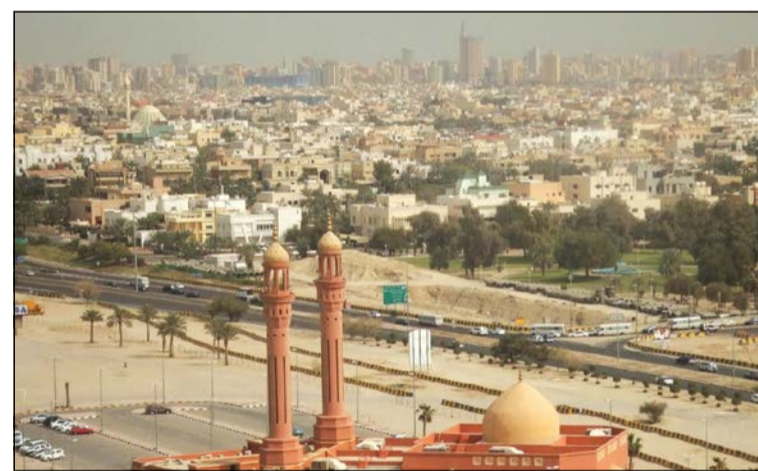
منظر عام لمنطقة الشامية

تمتاز ببيوتها الكبيرة التي تصل مساحاتها إلى 750 متراً مربعاً، كما تمتاز وتنظيمها الداخلي، حتى إنها تعتبر من المناطق النموذجية في الوقت الحالي.