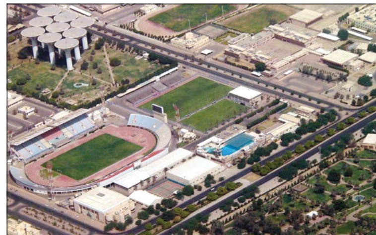
ستاد الصداقة والسلام بمنطقة العديلية

تمتاز منطقة كيفان بوجود البيوت الحكومية ذات المساحات الصغيرة التي تبدأ من 250 متراً وحتى 500 متر، لكن ما يسيء إليها هو وجود الكليات والنادي الرياضي والنادي الصحي والمسرح، ما يجعلها مزدحمة طيلة أيام العام.