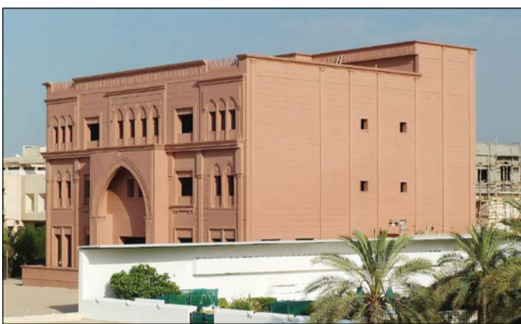
أحد القصور بمنطقة اليرموك

هذه المنطقة مرغوبة من قبل أغلبية الأثرياء بسبب قربها من العاصمة وإطلالتها على الدائري الأول، كما تنتشر بها منازل ودواوين عوائل عريقة في الكويت من بينهم وزراء وتجار معروفون ولها ثقل سياسي.