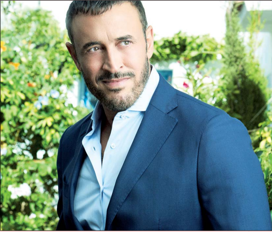
كاظم في فيديو كليب «عيد العشاق»

الفيديو كليب نتاج التعاون بين «بلاينيوم ريكوردز» و«جاكوار الشرق الأوسط وشمال أفريقيا»