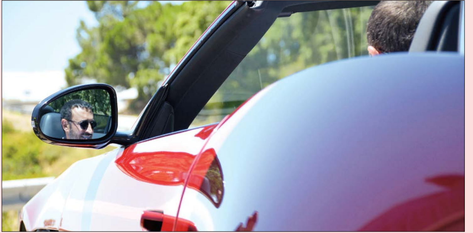
اتاققة سيارة جاكوار F-TYPE الرياضية الجديدة