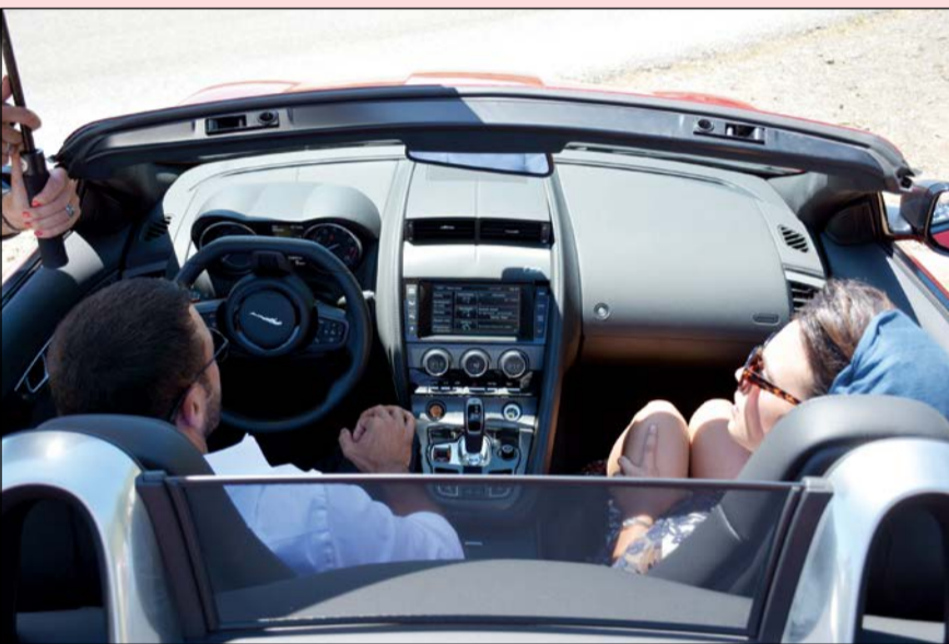
الساهر يقود بحماس عبر جبال الأندلس سيارة من طراز جاكوار F-TYPE S القابلة للكشف

بلاتينيوم ريكوردز». فيما حرص المخرج دي مندوثا، الذي سبق أن تعاون مع إريكيه إغليسياس وسواه من المغنيين العالميين، على وضع كاظم في دائرة متحررة من الشهرة والنجومية، وملبئة بالبساطة والرفي. يصور الكليب الغنائي الفنان كاظم الساهر فيما يقود بحماس عبر جبال الأندلس سيارته من طراز جاكوار F-TYPE S القابلة للكشف. ويشير إلى أن الكليب الغنائي الرائع هو نتاج التعاون بين «بلاينيوم ريكوردز» وشركة تصنيع السيارات الرائدة جاكوار الشرق الأوسط وشمال أفريقيا، شريك السيارات الرسمي لها. وبعد النجاح الذي حققته الشركتان في حفل «فن الأداء» - The Art of Performance، السنوي، بواصل اللابعان الرئيسيان في قطاعيهما تعاونهما في كليب الساهر بهدف تكريم ودعم مختلف جوانب قطاع الموسيقى العربية. وتعليقاً على هذا التعاون، قال سلمان سلطان، مدير العلاقات الإعلامية والإعلام الاجتماعي في شركة جاكوار لاند روفر الشرق الأوسط وشمال أفريقيا: «نحن متحمسون أفريقيا: لشمسنا شركة أحد أساطير عالم الموسيقى في المنطقة،