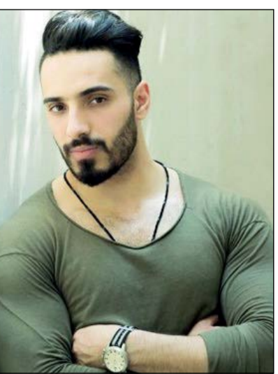
ليث أبو جودة

أحيا نجم «ستار أكاديمي» بنسخته العاشرة الفلسطينية ليث أبو جودة الملقب بـ «أسد المسرح» قبل أيام أول حفل غنائي داخل فلسطين، وذلك ضمن مهرجان «صيف رام الله»، وسط حضور كبير من جميع الأعمار الذين استمتعوا بأغاني أبو جودة التراثية الفلسطينية والتي أعادتهم للزمن الجميل. وأدى ليث للحضور أغنية «حارة السفارين» و«أنا اللي عليكي مشتاق»، وذلك تقديراً لهم لحضورهم لحفله الأولى في فلسطين والتي دامت أكثر من ساعة من الغناء العربي الأصيل. وبعد الانتهاء من حفله غادر ليث أبو جودة فلسطين متجهاً إلى العاصمة الأردنية للقاء جماهيره فيها من خلال حفله الثانية من جولاته الغنائية الصيفية. أما عن جديده الغنائي، فهو يستعد حالياً لطرح أغنية «شو ما صار» في غضون الأيام المقبلة.