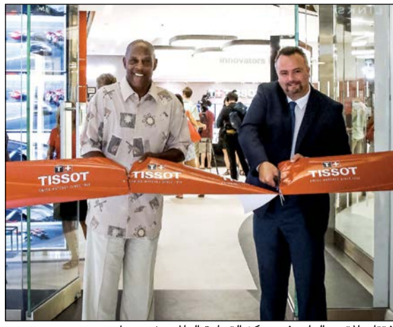
افتتاح المتجر الرابع في مركز التجارة العالمي بنيويورك