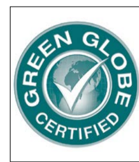
شهادة جرين جلوب

العاملو الفندق وتفاهمهم المستمر، ويمثل هذا التكريم دليلا على سعيتهم المتواصل للتميز في مجال تقديم خدمات استثنائية. وحصد الفندق هذا العام أيضا مزيدا من التقدير لممارسته الصديقة للبيئة والتي جاءت متمثلة في جائزة «أفضل فندق فاخر صديق للبيئة في منطقة الشرق الأوسط»، فضلا عن جائزة «أفضل فندق فاخر في الكويت» خلال حفل توزيع جوائز «لاجري لايف ستايل أوردز» العالمية المرموقة والمتخصصة بقطاع الضيافة. وتدير مجموعة حميرا للضيافة العالمية الفاخرة والعضو في دبي القابضة، حفظة تضم مجموعة من الفنادق والمنجعات الفاخرة العالمية المستوى، تشمل مشروعاتها الأبرز فندق برج العرب جميرا، ومنشآت فندقية في دبي وأبوظبي والإمارات والكويت بالشرق الأوسط، وياكو وفرانكفورت واسطنبول ولندن ومايوركا في أوروبا، والمالديف وشنغهاي في آسيا.