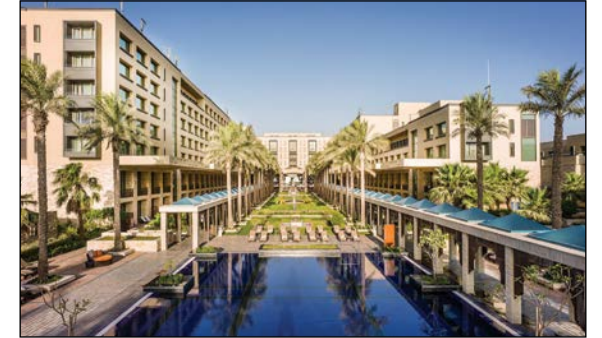
فندق ومنتج جميرا شاطئ المسيلة