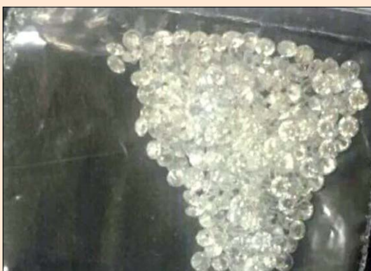
الألماس المضبوط في المطار

وأشار المصدر الى ان الألماس المضبوط لم تعرف قيمته نظر الكون سعره مرتبطا بمدى نقاته، وتم إبلاغ مراقب عام مطار الكويت عيسى بن عيسى الذي أمر باتخاذ الإجراءات القانونية بحق الآسيوي.