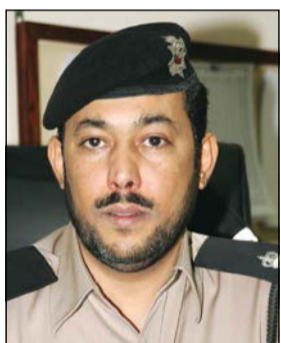
العميد عبد العزيز الهجري

شاهدت مركبة كان قائدها يترنج بين خانات الطريق، وعليه تم توقيفه واتضح انه مواطن خارج نطاق التغطية، وتمت مشاهدة سلاح ناري (كلاشينكوف)، وعليه تم رفع تقرير بالواقعة واحالة الشخص الى جهة الاختصاص.