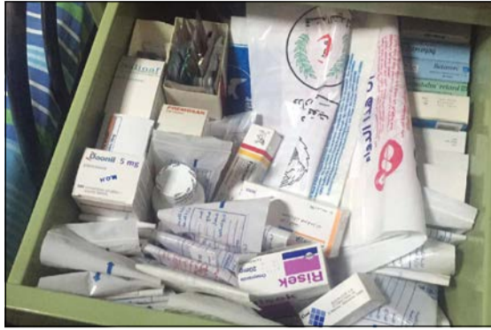
الصيدلي اقر بمزاولة مهنة الطب