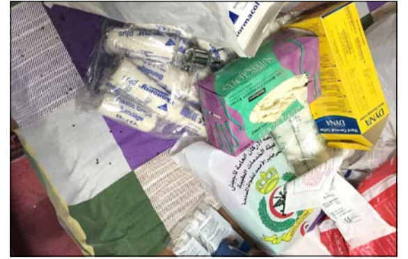
الأدوية تعالج مختلف الأمراض