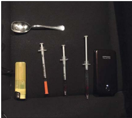
من مضبوطات الأمن العام جيوب مواد تعاط ومواد مخدرة