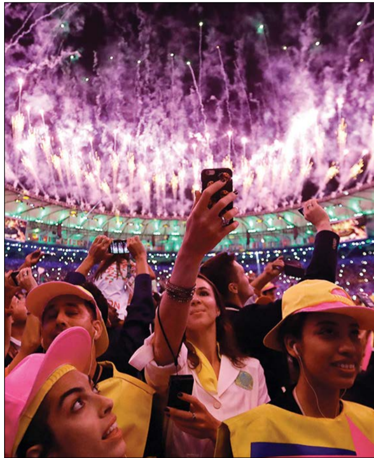
صورة جميلة من حفل الافتتاح الذي احتضنه «ستاد ماراكانا»

قالت الحكومة البرازيلية، أول من أمس إن ما لا يقل عن 500 ألف زائر أجنبي وصلوا إلى البلاد لحضور الألعاب المقامة في مدينة ريو دي جانيرو. وأوضحت بيانات، جمعتها الشرطة الاتحادية في نقاط الهجرة، وكشفت عنها وزارة السياحة البرازيلية، في الفترة من أول يوليو الماضي، حتى 15 الجاري. ورغم أن الأولمبياد بدأت في الخامس من أغسطس تعود هذه البيانات لفترة سابقة للأخذ في الاعتبار وصول كثير من الرياضيين والموظفين والأجانب الآخرين قبل بدء الأولمبياد