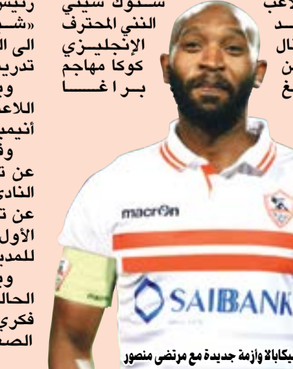
شيكابالا وأزمة جديدة مع مرتضى منصور

القاهرة - سامي عبدالفتاح قلب الهولندي مارتين يول المدير الفني السابق للأهلي الطاوله على إدارة الأهلي بتأكيده ان إدارة الأهلي هي التي أبلغته بالاستغناء عن خدماته. ونفى يول في حديثه لصحيفة «ايندهوفن داغبلاد» الهولندية، أن يكون رحيله مرتبطا بما حدث في مران الفريق، بعدما اعتدت مجموعة من الجماهير على اللاعبين، خلال مران الفريق. وقال يول لصحيفة الهولندية «لم أكن خائفا من الأحداث التي شهدتها المران، بل كنت مستمتعا بالأجواء»، مضيفا ان إدارة النادي الأهلي أعلنت في بيان رسمي، انني قررت إنهاء التعاقد لأسباب شخصية، وأوضح أنه يستعد لمغادرة مصر خلال 48 ساعة بعد التفاوض مع إدارة النادي حول كيفية إنهاء التعاقد بين الطرفين. كان الهولندي مارتين يول، الذي تولى تدريب الفريق المصري قبل 6 أشهر، تقدم باستقالته الخميس الماضي إلى مجلس إدارة الأهلي المصري، بداعي الخوف على حياته الشخصية. ووجه محمود طاهر، رئيس مجلس إدارة النادي الأهلي، وسيد عبدالحفيظ، مدير الكرة بالفريق الأول لكرة القدم بالنادي، تحذيرا شديدا للجهة للاعبين المقصرين والخارجين عن النص خلال الاجتماع الذي عقد الجمعة قبل تدريبات الفريق على ملعب مختار التتش. وانتظم عمرو وجمال، مهاجم الأهلي، في تدريبات الفريق، ردا على شائعات الرحيل التي طارده عقب واقعة الاعتداء عليه من جانب رابطة التراس أهلاوي. من جهة أخرى، تلقى اتحاد الكرة المصري خطابا من الاتحاد الدولي لكرة القدم (فيفا) يفيد بالموافقة على إدراج وديتي الفراعنة أمام غينيا وجنوب أفريقيا يومي 30 الجاري و6