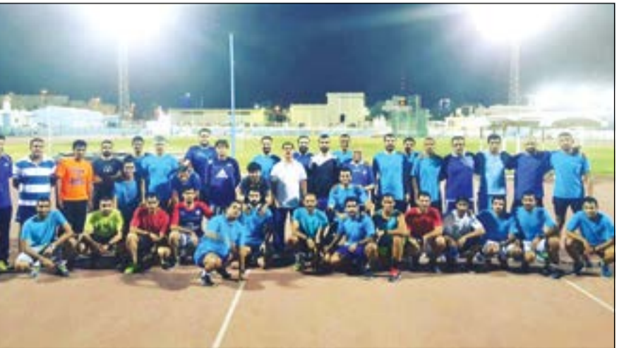
استعدادات الحكام متواصلة للموسم الجديد

استعدادا لخوض الاختبارات للكشف على مدى جاهزيتهم لإدارة مباريات الموسم المقبل المقرر انطلاقه 26 الشهر الجاري مع دوران عجلة بطولة دوري الريف، وكان من المقرر أن تغادر بعثة الحكام إلى القاهرة أو تركيا لإقامة معسكر إعدادي، لكن الهيئة العامة للرياضة أعاقت برنامج اللجنة بعدم صرف المخصصات المالية لأفراد البعثة البالغ عددها (46) حكما.