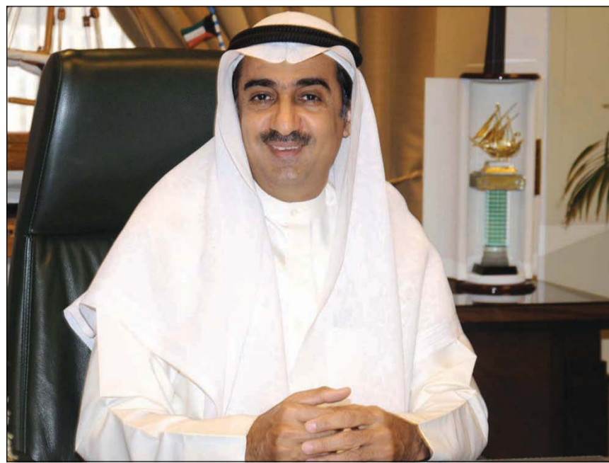
د. يوسف العلي

وقال الوزير العلي ان المنطقة الحرة بالنويصيب تقع في موقع جغرافي فريد، مشيراً الى انها ستكون قريبة من خط السكك الحديدية الخليجية المزمع إنشاؤه بجوار المنطقة الحرة، مما يساعد على سرعة نقل البضائع إلى دول العالم، بالإضافة إلى انها ستسهم في إحداث رواج كبير للصناعات التحويلية ونقل وتجارة البضائع، وأفاد بأن هذه المناطق التجارية لا تخدم المشاريع الرأسمالية او النفطية وغيرها، فهي تهدف إلى الصناعات الخفيفة والمخازن التي تعبر من خلالها البضائع، وبالتالي فهي منضبة على مفهوم الشكل المحدد للمنطقة الحرة سواء تجارية بحثة أو إدارية او صناعات خفيفة، حيث تدخلها البضائع كتل كبيرة يعاد تغليفها أو تحسينها لتنتقل مرة أخرى إلى خارج البلاد، وقد يدخل منها جزء داخل البلاد، وأهم ما يميز هذه المناطق أنها تعفي من الرسوم الجمركية وبالتالي تشجع على إعادة التصدير بشكل أكبر.