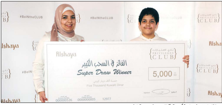
وفائزة تتسلم شيكاً بـ 5 آلاف دينار من الشايح

9 فائزين بجوائز تبلغ قيمتها الإجمالية أكثر من 60 ألف دينار