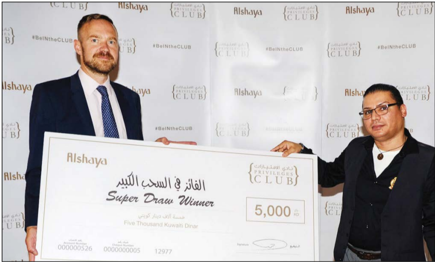
شيك بـ 5 آلاف دينار للفائز في السحب الكبير

أعلنت شركة محمد حمود الشايح عن أسماء الفائزين في أول سحب ربع سنوي في «نادي الامتيازات»، وقد حصل الفائزون على جوائز بلغ مجموع قيمتها أكثر من 60 ألف دينار. ويأتي هذا السحب كجزء من مجموعة واسعة من المزايا التي يحصل عليها أعضاء نادي الامتيازات الخاص بشركة الشايح. وقد حصل الفائز الأول على جائزة قيمتها 15000 دينار، في حين فاز 3 بجوائز قيمتها 7500 دينار لكل منهم، وكسب 5 آخرون جوائز بقيمة 5000 دينار لكل منهم، وتقدم جميع هذه الجوائز للفائزين كرسيد في بطاقات الشايح.