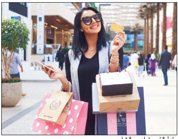
متعة التسوق لدى «الشايح»