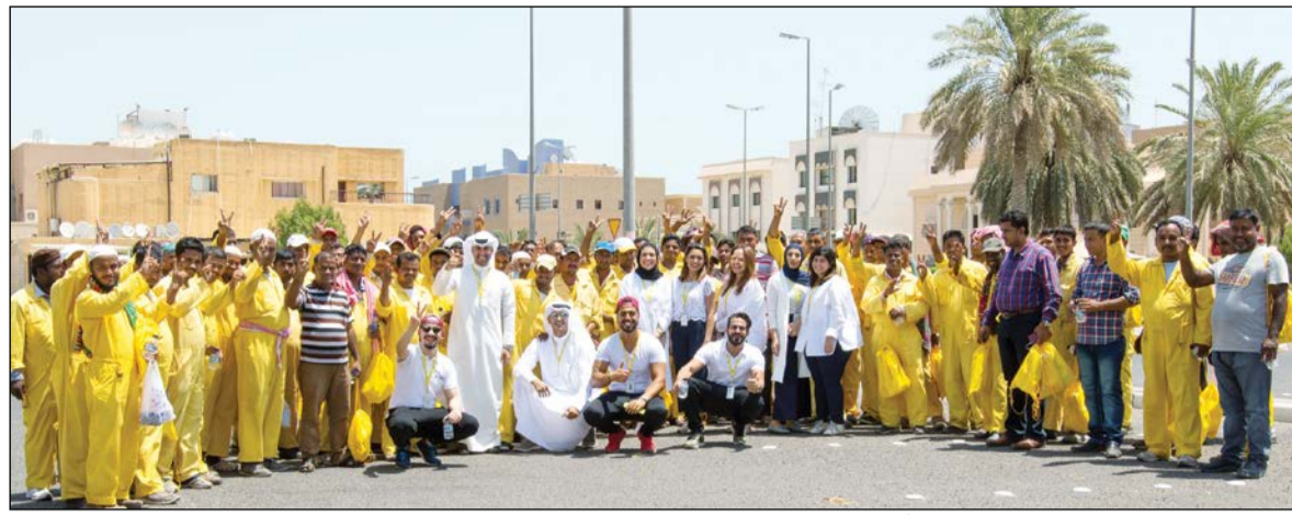
فريق «الأهلي الكويتي» مع عدد من العمال في أحد مواقع العمل