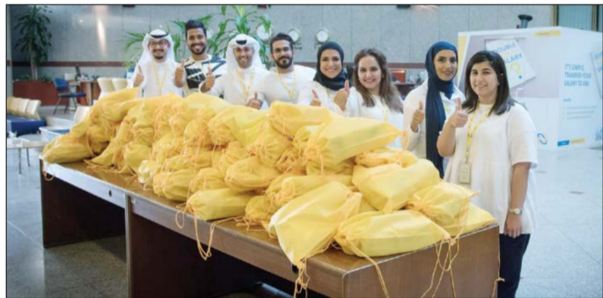
عدد من موظفي الأهلي المشاركين بالحملة

يحتفل العالم بيوم العمل الإنساني في 19 أغسطس من كل عام، عن طريق إطلاق مبادرات ومشاريع مخصصة لتقدير الأشخاص العاملين في مجال العمل الإنساني وتشجيع الأعمال الإنسانية حول العالم. وقد شارك البنك الأهلي الكويتي باليوم العالمي للعمل الإنساني من خلال تطوع مجموعة من موظفي البنك لتوزيع مساعدات على عمال النظافة المنتشرين في مناطق الكويت، إيماناً منه بدعم هؤلاء العاملين وتعزيز مفهوم العمل الإنساني في المجتمع. وتم توزيع حقائب احتوت على منشقة ومراوح تعمل بالبطارية وقبعات وزجاجات مياه، لمساعدة عمال النظافة على تجنب إصابتهم بالجفاف وتخفيف حرارة الصيف قدر المستطاع. ويسعى البنك الأهلي الكويتي من خلال هذه المبادرة إلى الاستمرار في دعم الأنشطة الاجتماعية وترسيخ مفهوم المسؤولية الاجتماعية.