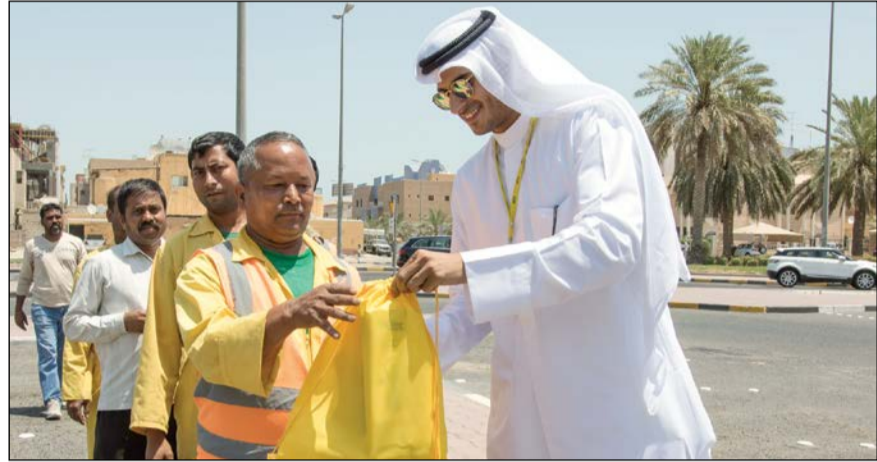
تقديم المساعدات للعمال في أماكن عملهم