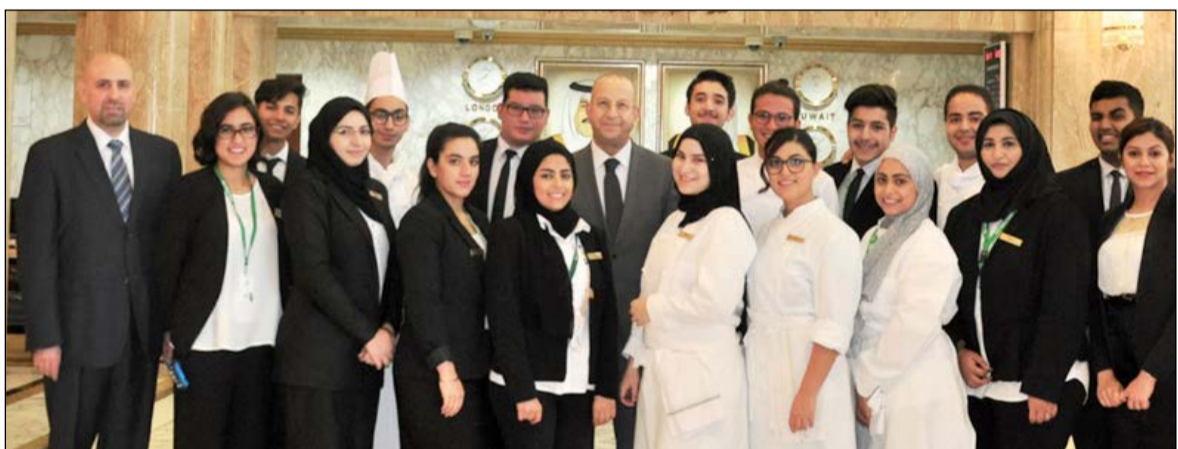
لقطة تذكارية مع متدربي الدورة الصيفية 2016

وتشارك فنادق شيراتون الكويت وفوربوينتس شيراتون الكويت في هذا البرنامج التدريبي إيماناً منها بأهمية دعم الأجيال المقبلة وفتح الطريق أمامهم لبدء مسيرتهم المهنية وبناء مستقبل ناجح فضلاً عن تنمية إمكانات الشباب واستثمار وقت الفراغ لديهم بما ينفعهم في حياتهم العملية والاستفادة من العطلات الصيفية بباقة من المعارف والخبرات التي تزيد من إبداعهم وتنمي سبل تفكيرهم نحو المستقبل الواعد. وبهدف المناسبة، عبر