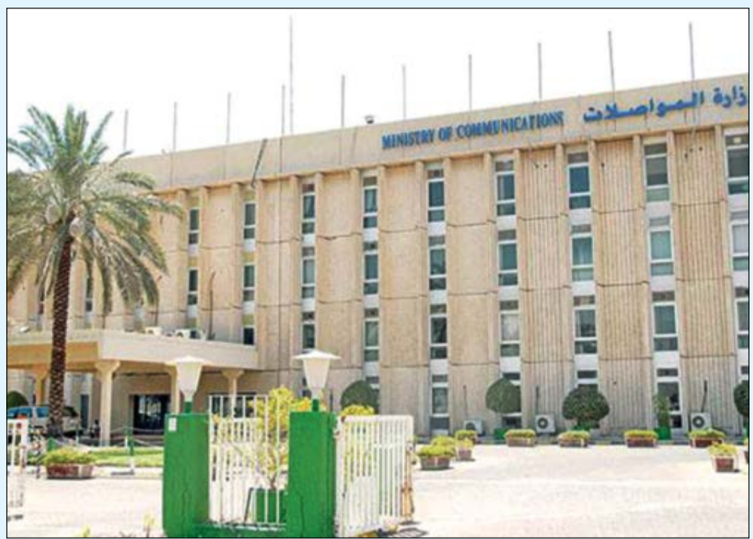
مبنى وزارة المواصلات