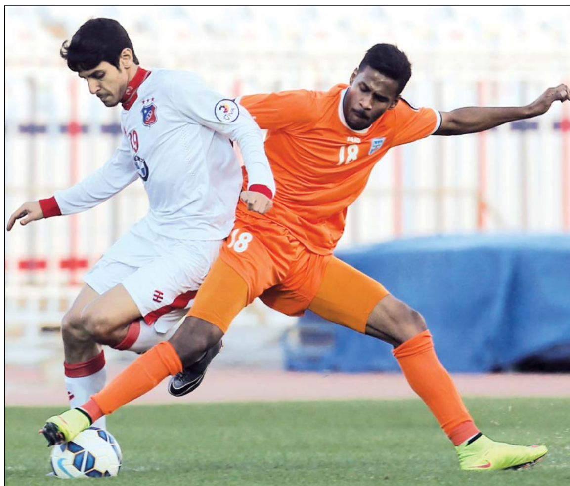
كازمة يلتقي الكويت في تركيا